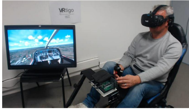
Figure 1: Plateforme VRtigo.