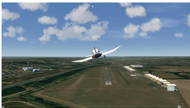
Figure 3: Aéroport de Toulouse-Matabiau et ses repères