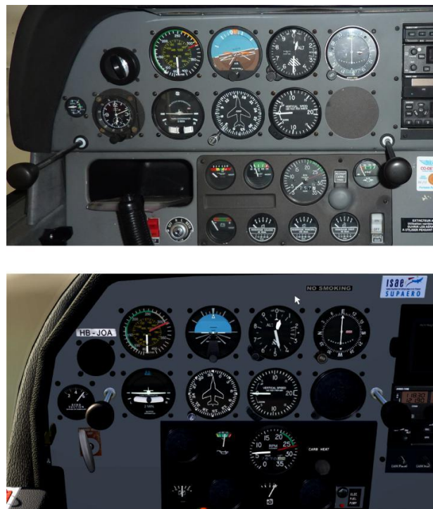
Figure 2: Cockpit DR400 F-GTPZ de Lasbordes (haut), cockpit DR400 Aerofly2 modifié (bas).

Un scénario de vol, défini avec les pilotes instructeurs, consistait en une succession de tours de pistes. Un tour de piste, qui dure environ 8mn, est composé des phases suivantes : décollage, montée initiale, virage en montée, mise en palier, virage en palier, préparation machine (action volets), virage en descente, descente stabilisée, interception d'un axe et d'un plan pour le dernier virage, préparation de l'avion à l'atterrissage (action volets), atterrissage. Nous demandons aux pilotes d'effectuer 3 tours de pistes consécutifs, avec 2 poser-et-décoller, et l'atterrissage complet au dernier tour sur la piste R33 de l'aérodrome de Lasbordes. Ce scénario présente l'avantage d'être standardisé et de nous permettre ultérieurement de pouvoir comparer la performance en conditions VR et réelles de vol.