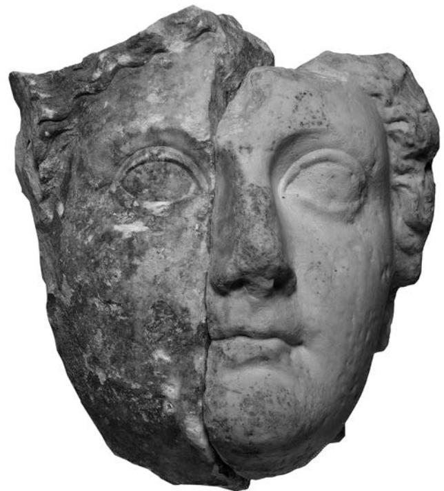
Fig. 4 – Tête colossale de Livie conservée au Museum am Dom (partie gauche) et au Musée national d'art et d'histoire du Luxembourg (partie droite) (cliché : Th. Zühmer).

n°s 4-12). Il faut toutefois remarquer que quatre d'entre elles sont contremarquées et deux coupées, ce qui rend leur durée de circulation sans doute assez longue. On observera aussi que la série monétaire ne recommence qu'avec les émissions de Caligula, de sorte que les témoignages numismatiques font défaut pendant une vingtaine d'années. L. Schwinden remarquait qu'une inscription du prêtre Priscus, datable du milieu du 1 er s. apr. J.-C., appartenait assurément aux niveaux les plus anciens 30 . L'absence de matériel et de structures précoces implique avant tout une fondation de l'Irminenwingert au plus tôt vers le milieu du 1 er s. apr. J.-C. La seule objection a été apportée par H. Merten : celle-ci considérait que l'inscription dédiée aux Xulsigiae démontrait l'existence d'un culte plus ancien. N'ayant pas subi d' interpretatio romana , elle ne pouvait provenir, selon elle, d'un autre lieu éloigné et devait se référer à un culte local préromain 31 .