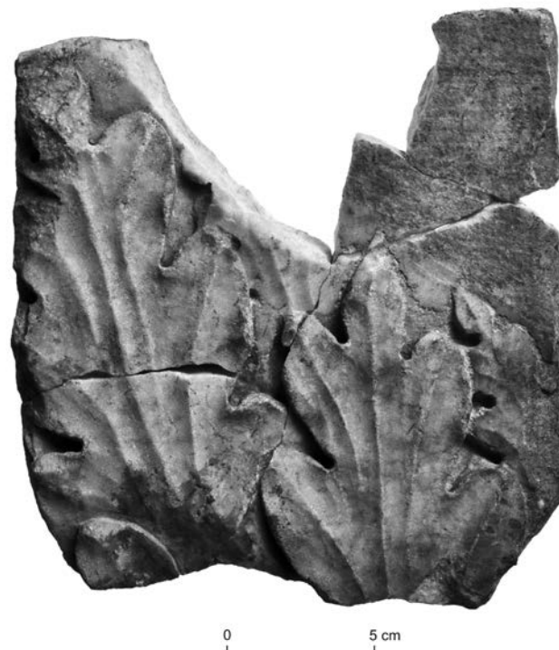
Fig. 3 – Fragment de feuille d'acanthé en marbre conservé au Landesmuseum Trier.

début des travaux aurait eu lieu pendant le séjour d'Auguste en Gaule (16 av. J.-C.), juste après la construction du pont de Trèves et l'hypothétique date de fondation du 23 septembre 17 av. J.-C. (Goethert, 2003).