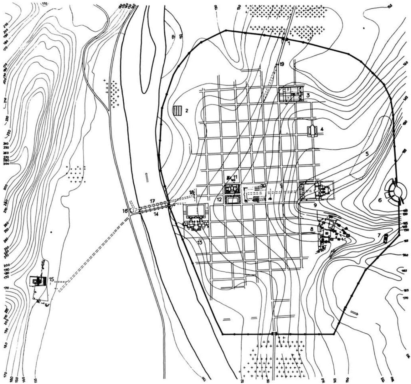
Fig. 1 – Plan de Trèves, vers la fin du II s. apr. J.-C. : 1, Porta Nigra ; 2, horrea de Saint-Irminen ; 3, basilique double, cathédrale de la Liebfrauenkirche et de Saint-Laurent ; 4, Aula Palatina ; 5, cirque ; 6, amphithéâtre ; 7, temple « am Herrenbrunnchen » ; 8, sanctuaire de l'Altbachtal ; 9, thermes impériaux ; 10, forum ; 11, palais ; 12, palais double ; 13, thermes de Barbara ; 14, second pont romain à piles de pierre ; 15, sanctuaire de Lenus Mars (Irminenwingert) ; 16, exèdre à l'extrémité occidentale du premier pont en bois ; 17, pont sur pilotis de bois ; 18, porte et fondation de l'arc « am Bollwerk » ; 19, porte et fondation de l'arc de la Simeonstrasse ; NB : le camp protoaugustéen du Petrisberg se trouve hors plan, sur la colline qui domine la ville vers l'est (d'après Rheinisches Landesmuseum Trier , 1979, fig. 1).

« chemins de terre » ( Sandstrassen ) (Löhr 1998, p. 22). On les a particulièrement bien documentés au Viehmarkt, où l'on a parfois mis en évidence jusqu'à trois fines couches de terre riches en matériel sous la première strate empierrée 13 . Le mobilier mis au jour dans ces contextes est chronologiquement très homogène et attribuable à l'époque tardo-augustéenne, il témoigne d'une durée de dépôt relativement courte. Un fait plaide contre une durée d'utilisation trop longue : la couche concernée n'est épaisse que de quelques centimètres et serait devenue sûrement encore plus épaisse à la suite d'un usage