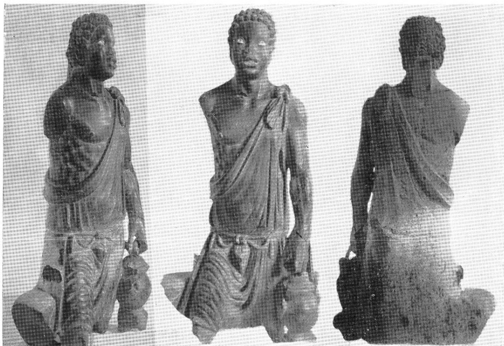
Fig. 5. — Nègre situlophore, d'Aphrodisias en Carie (?).

ou commerçants voyageant par mer pour apporter les vins d'Italie, de Gaule, d'Espagne, capitaines de vaisseaux ( trierarchi ), etc... — tout ainsi qu'à Cologne où le culte d'Isis s'était implanté 39 — devaient fréquenter à Strasbourg les parages qui sont ceux de Saint-Étienne aujourd'hui (ancien port de guerre), et les bassins de commerce reconnus entre la chapelle Saint-Martin et Saint-Thomas, à l'endroit appelé Rheinecke . Certes, des Alexandrins autres que navi-