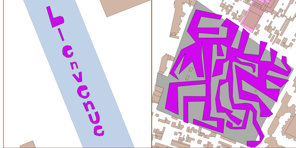
FIGURE 3. Vandalisme synthétique de type artistique