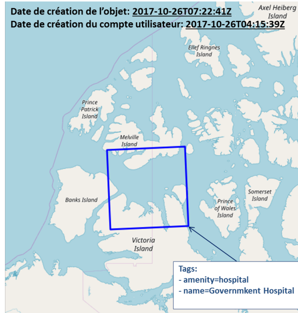
FIGURE 2. Erreur de débutant : cartographie d'un hôpital dont la géométrie chevauche plusieurs îles au Nord du Canada.

qui pourrait justifier l'acte de ce contributeur. Par conséquent, on ne peut pas affirmer que sa contribution dégrade la qualité de l'objet.