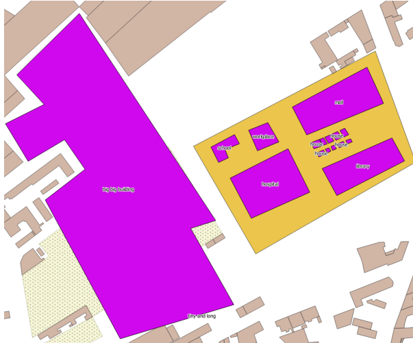
FIGURE 4. Vandalisme synthétique de type fantaisiste

Comme le vandalisme synthétique consistait à ajouter des objets fictifs et artistiques, on se contente pour l'instant de calculer des variables géométriques (Table 4). Ainsi, l'algorithme de clustering regroupera les objets dont les attributs géométriques sont similaires en mettant de côté les bâtiments présentant des valeurs particulières, comme ceux de la Figure 3.