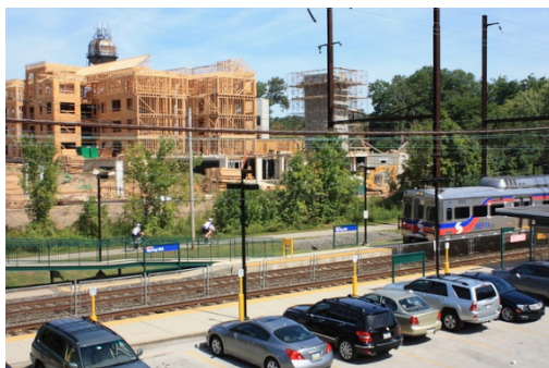
Transit Oriented Development et multimodalité