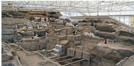
A Çatal Höyük, on accédait aux maisons par les toits