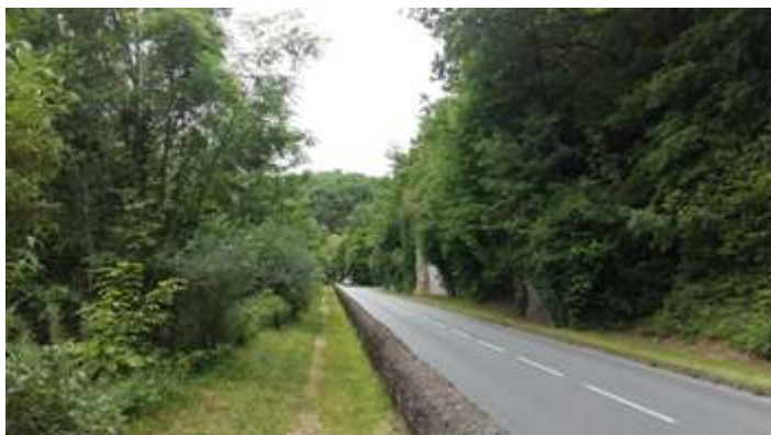
Figures 7 et 7bis. Repères de crue le long de la route départementale près des Eyzies-de-Tayac