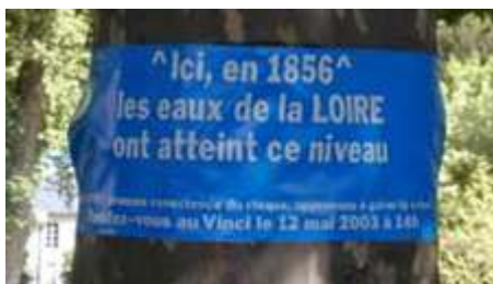
Figure 13. Opération Bandeaux bleus à Tours, 2003

marine. S'y rajoute un trait « de précaution » supérieur de 20 centimètres, rappelant qu'un nouvel événement peut dépasser la côte de Xynthia . Si la peinture n'est volontairement pas pérenne dans le temps, trois ans après le projet, en 2017, les arbres ont été repeints par l'ONG Bleu versant 22 . Mais, en 2014, cette opération très visuelle dans l'espace, a suscité nombre de commentaires, les habitants croyant au début que ces arbres étaient marqués pour être coupés. De même, l'opération Bandeaux bleus, menée en 2003 à Tours, avait installé des repères de crue éphémères sur les arbres du quartier des Prébendes pour sensibiliser la population au risque d'inondation (figure 13).