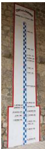
Figure 6. Échelle de crues de Cadillac (Gironde) située à l'entrée de la porte fortifiée