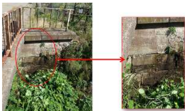
Figures 1 et 1bis. Repères de crues (de janvier 1910 et de décembre 1919) à Schirmeck – La Broque, vallée de la Bruche, exhumés sous la végétation