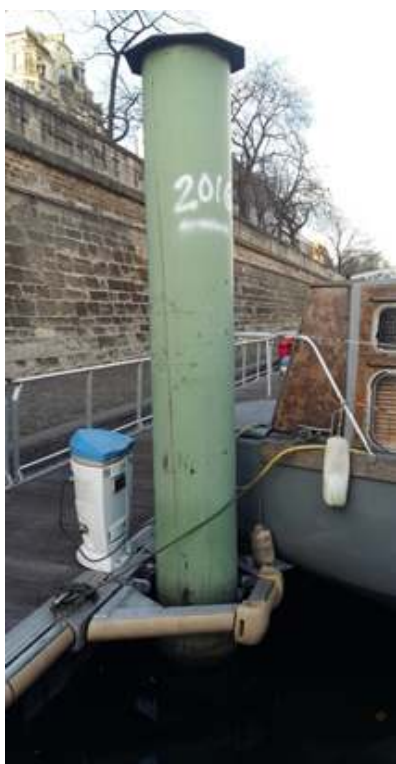
Figure 3. Port de l'Arsenal (Paris)

pompier de Sewen en Alsace, suite aux inondations de février 1990 13 . En Gironde, après l'envoi d'un questionnaire sur l'histoire et la mémoire des inondations, un habitant a également témoigné : « Sur la maison, mon père avait marqué le niveau de la crue centennale de 1944. Je souhaitais pouvoir marquer cette information avec le repère qui a été installé par EPIDOR 14 sur des communes voisines. Malgré une tentative de négociation, restée vaine, pour obtenir ce repère métallique très bien conçu, j'ai fait placer, très visible en bordure de route, une plaquette signalétique réalisée par un graveur. Les promeneurs sont très heureux de trouver cette information. Les acquéreurs de maisons ou de terrains viennent voir » (homme, 80 ans, commune de Sainte-Terre, sur la Dordogne, Gironde, interrogé l'hiver 2016) 15 .