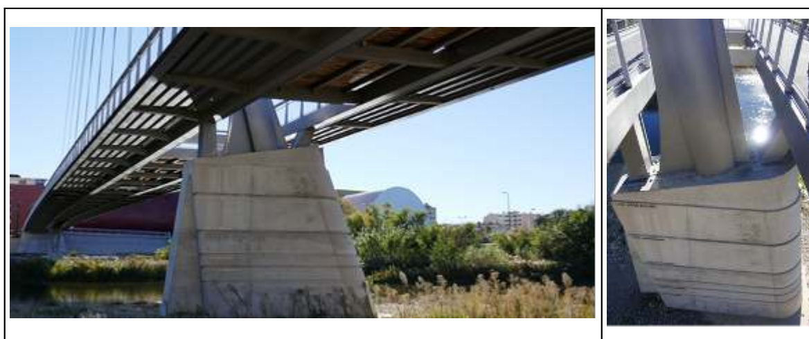
Figures 12 et 12bis. Hauteurs des crues selon leur période de retour sur une pile de la passerelle piétonne inaugurée en 2015 sur la Têt à Perpignan