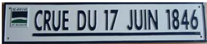
Figure 2. Nouveau repère de crue proposé par la commune de Saint-Pryvé-Saint-Mesmin avant la loi Bachelot