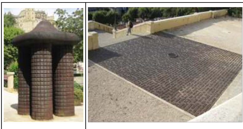
Figures 16 et 16bis : « L'abri impossible » à Auch et « L'observatoire du temps » de Jaume Plensa