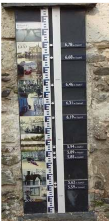
Figure 5. À Béhuard, crues référencées de la Loire entre 1904 et 2000