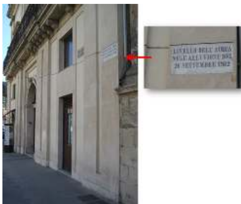
Figures 11 et 11bis. Repère de crue linéaire sur la façade d'une maison à Modica (Sicile), représentant la hauteur atteinte par l'inondation du 26 septembre 1902 qui causa la mort de 300 personnes

Sa non-horizontalité interpelle aussi la fiabilité dans l'espace de repères très ponctuels.