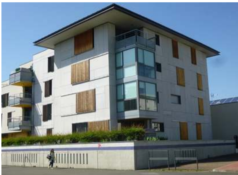
Figures 9 et 10 : Ligne bleue marquant la hauteur que l'eau pourrait atteindre à Saint-Pierre-des-Corps. Cette « marque de crue » linéaire est très visible dans l'espace public