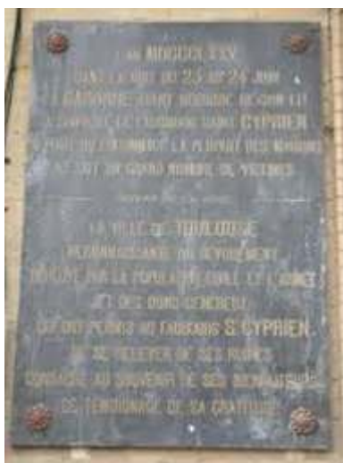
Figure 15. Plaque de crue dans le quartier Saint-Cyprien, Toulouse

TRANSCRIPTION : En haut : « L'an 1875, dans la nuit du 23 au 24 juin la Garonne ayant débordé de son lit a couvert le faubourg St Cyprien détruit ou endommagé la plupart des maisons et fait un grand nombre de victimes. » En bas : « La ville de Toulouse reconnaissante au dévouement déployé par la population civile et l'armée et des dons généreux qui ont permis au faubourg St Cyprien de se relever de ses ruines consacre au souvenir de ses bienfaiteurs ce témoignage de sa gratitude. » Et entre ces deux textes, le niveau de la crue.