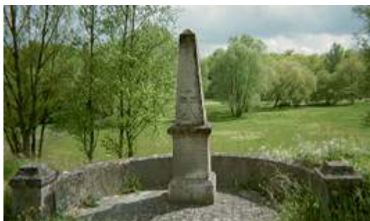
Figure 14. Monument à la mémoire d'une victime d'inondation à La Ville-aux-Dames