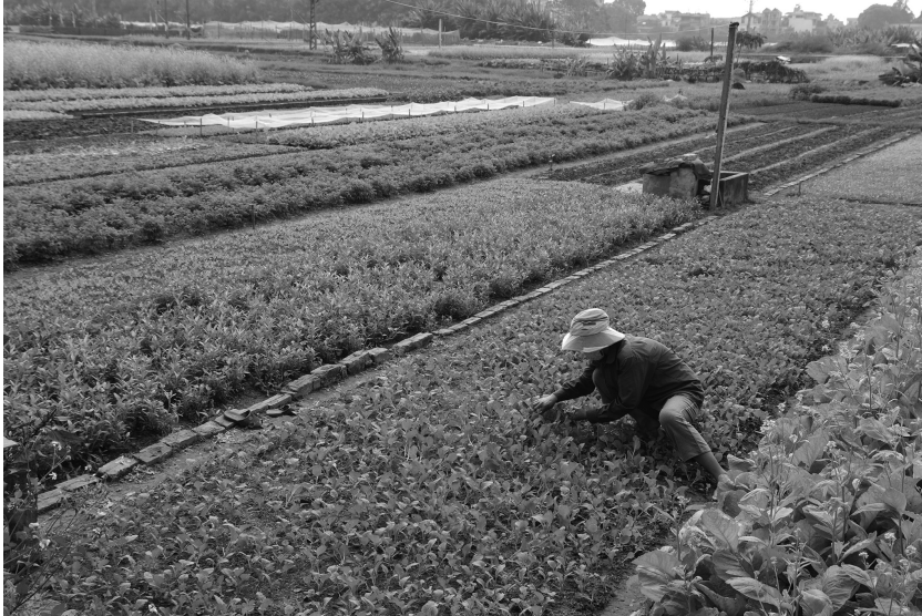
Fig. 1 : Production de légumes dans la frange urbaine de Hanoï.