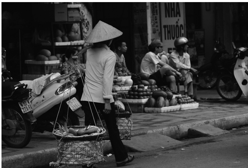
Fig. 3 : Vente de rue fixe et ambulante à Hanoï : un mode d'approvisionnement qui persiste.

Il n'en demeure pas moins que cette forme d'approvisionnement dans la rue reste ancrée dans les habitudes des Hanoïens, surtout parce qu'elle a pour attribut d'être locale (Wertheim-Heck, Vellema et Spaargaren, 2015). Cette proximité assure le tissage de relations de confiance entre vendeurs et acheteurs : ces derniers peuvent ainsi obtenir les meilleurs prix et réaliser, quand nécessaire, des achats à crédit (Moustier et Dao, 2006). Enfin, les consommateurs estiment alors avoir une meilleure connaissance de l'origine des produits et transposent aux denrées la confiance qu'ils font au vendeur.