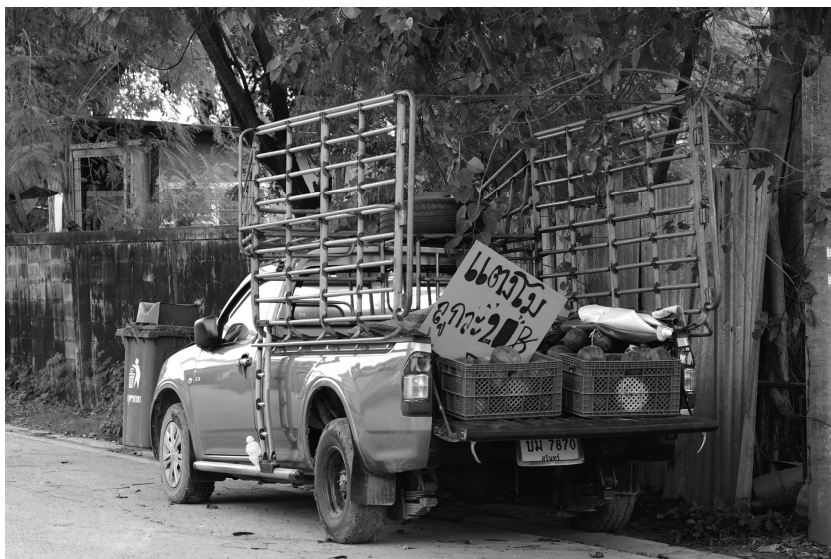
Fig. 2 : Vente de fruits dans un pick-up : un exemple de filière courte informelle à Bangkok.