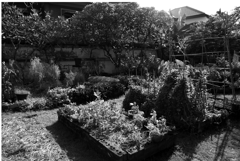
Fig. 6 : Jardin privé transformé en centre de formation à l'agriculture urbaine biologique à Bangkok, associé au groupe Heart Core Organic .