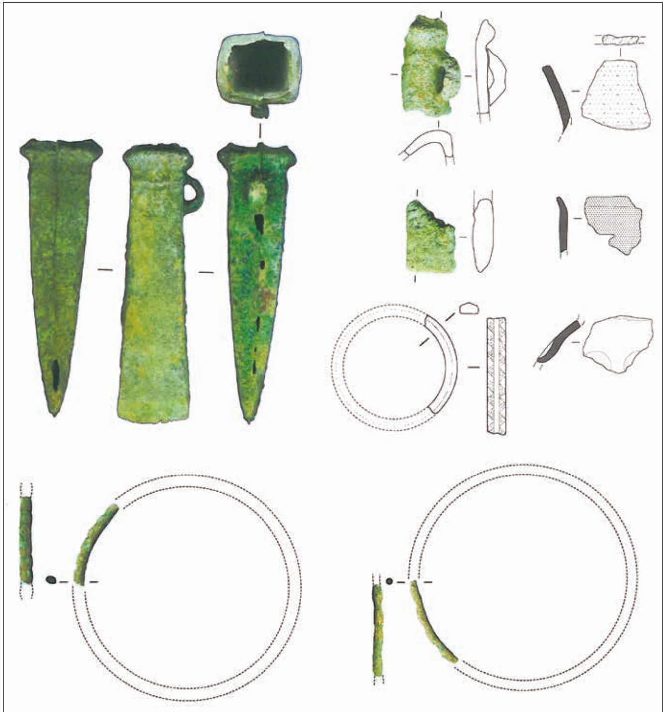
Figure 2 – Sélection de bronzes et de céramiques et le fragment de bracelet en lignite de Kergariou. Échelles diverses. Cl. Yves Menez/dessins, M. Dupré.

du moule souvent non éliminé, en font des instruments non fonctionnels. Seules quelques-unes, du très rare type de grande taille de Brandivy, à tranchant légèrement élargi, peuvent rester utilisables (Briard, 1965, p. 254).