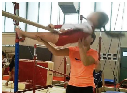
Figure 3 : L'entraîneur O facilite la réalisation d'une bascule faciale en soutenant les jambes avec sa main droite et le dos avec sa main gauche

« Je mets une main aux jambes pour les soutenir car c'est un problème récurrent de tenir ses jambes pour la bascule ; mais il ne faut pas qu'elles s'habituent car ça leur fait un appui. Je soutiens moins au fur et à mesure qu'elles progressent » (Entraîneur O, bascule faciale aux barres asymétriques, Figure 3).