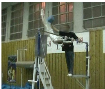
Figure 25 : la main de l'entraîneur prolongée par un bloc de mousse apparaît comme cible à atteindre par le gymnaste avec ses jambes

toucher (Figure 26). Par exemple, l'entraîneur P indique à une gymnaste : « Normalement, tu ne dois pas toucher ma main à l'arrivée ».