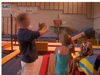
Figure 33 : l'entraîneur montre une courbe arrière, formée par le rapprochement des extrémités de la face dorsale de la main

L'usage des mains est opportuniste : « ça m'est venu comme ça ; je me suis dit qu'elle devait penser à remonter ses pieds vers le plafond et je lui ai montré avec ma main » (Entraîneur C). Les aspects saillants du mouvement, dont certains sont mis en lumière in situ par la figuration des mains, ponctuant et appuyant parfois des mots ou parfois s'y substituant, se synthétisent dans des formes globales signifiantes :