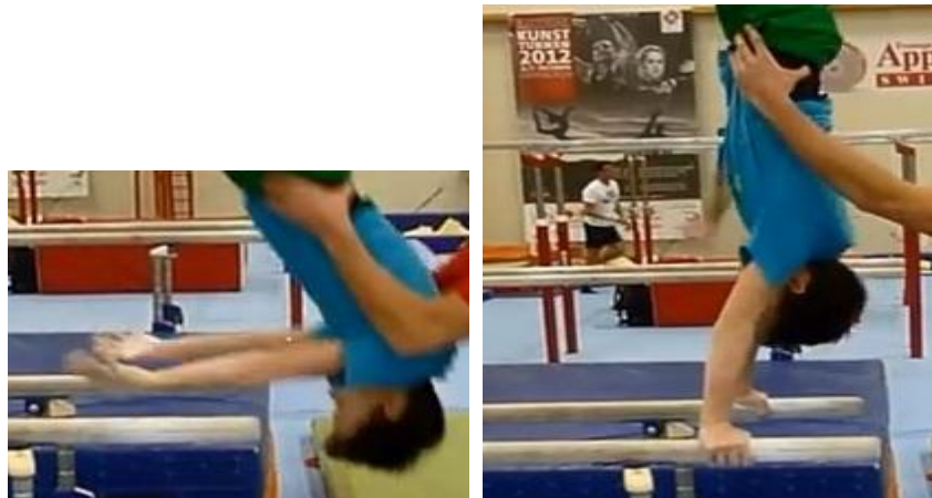
Figures 7 et 8 : changement de prise de mains en fin de réalisation du soleil

Son intervention a provoqué des transformations dans l'activité conjointe des gymnastes et de l'entraîneur I :