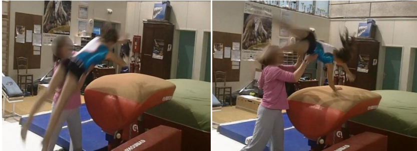
Figures 10 et 11 : Déplacements des mains de l'entraîneur au cours de la réalisation d'une rondade au saut

« Je mets une main qui sert à aller vers l'avant ; je mets ensuite l'autre main au ventre pour qu'elles se replacent dos rond pour enclencher le salto » (Entraîneur N, rondade au saut, Figures 10 et 11).