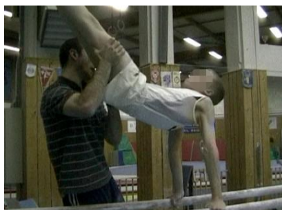
Figure 19 : Par ses opérations manuelles de soutien et déplacement, l'entraîneur I co-agence avec le gymnaste une forme corporelle géométrique

Les mains écoutent les résistances des corps à se déplacer, décryptent leurs fonctionnements synergiques et apprécient la plasticité morphologique des corps-gymnastes. L'entraîneur I positionne le gymnaste en appui facial aux barres parallèles en lui soutenant les jambes et déplace très légèrement son bassin vers l'avant afin qu'il « sente l'action » générant un « déplacement des épaules vers l'avant » et aboutissant à une « ouverture de l'angle bras-tronc » nécessaire à une élévation du bassin (Figure 19).