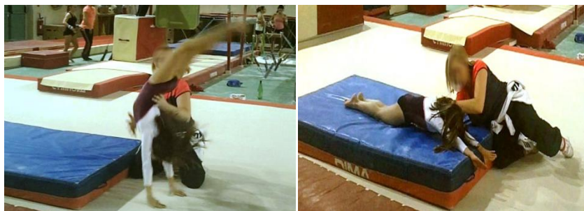
Figures 17 et 18 : interventions manuelles destinées à générer successivement les courbes arrière et avant composant le flip arrière au sol

Les mains écoutent les résistances des corps à se déplacer, décryptent leurs fonctionnements synergiques et apprécient la plasticité morphologique des corps-gymnastes. L'entraîneur I positionne le gymnaste en appui facial aux barres parallèles en lui soutenant les jambes et déplace très légèrement son bassin vers l'avant afin qu'il « sente l'action » générant un « déplacement des épaules vers l'avant » et aboutissant à une « ouverture de l'angle bras-tronc » nécessaire à une élévation du bassin (Figure 19).