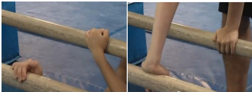
Figures 5 et 6 : Prises de mains au début et à la fin du soleil

L'entraîneur N a expliqué aux gymnastes pris en charge par l'entraîneur I : « c'est pas : je roule et je pose les pieds sur la barre sans changer de prise (Figures 5 et 6). C'est : je roule, je prends l'appui longtemps, longtemps sur la barre et je change l'appui (Figures 7 et 8) » .