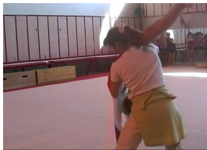
Figure 2 : L'entraîneur C place la gymnaste dans une position intermédiaire attendue

Ce type d'intervention manuelle vise alors à diriger, conduire la réalisation globale de l'habileté, ou encore à positionner le gymnaste et l'arrêter à un moment particulier de son déplacement (Figure 2).