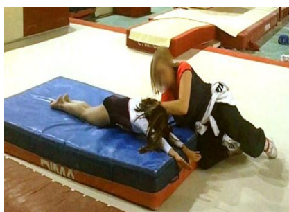
Figure 26 : la main de l'entraîneur P placée sur le ventre de la gymnaste est instrumentalisée comme cible à éviter

Les mains introduisent aussi des contraintes physiques auxquelles les gymnastes doivent résister ou des ressources sur lesquelles ils doivent plus ou moins prendre appui :