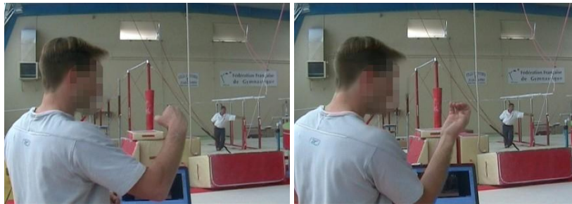
Figures 31 et 32 : l'entraîneur mime avec sa main deux phases successives

« la fin de la vrille \frac{1}{2} et la vrille avant sont couplées. Tu dois faire vrille \frac{1}{2} , puis je percute en salto et une fois que je suis parti dans ma trajectoire et ma rotation salto (il montre avec sa main une forme représentant le haut du corps qui s'arrondit (Figure 31)), je fais ma vrille avant. Pas avant » (il effectue une rotation avec son poignet en conservant ses doigts orientés vers le haut (Figure 32)).