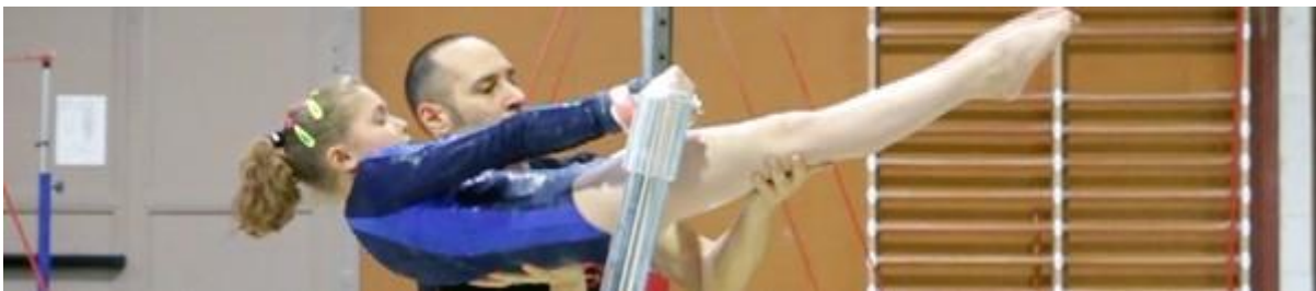
Figure 1 : L'entraîneur manipule le corps de la gymnaste lors de la réalisation d'une habileté aux barres asymétriques

but est de « faciliter l'exécution du geste tout en préservant la technique la plus parfaite possible » (Ritorto, Gymneo.tv). Focalisés sur l'analyse des habiletés gymniques à enseigner, les ouvrages de référence destinés à la formation des entraîneurs (Fédération Française de Gymnastique, 1997, 2003) ne rendent pas compte des pratiques d'intervention auprès des gymnastes, notamment de ces manipulations corporelles. Plus récemment et dans un contexte général de partage des expériences pratiques, soutenu notamment par la sphère internet, ces interventions particulières sont décrites par des entraîneurs expérimentés au moyen de supports audiovisuels conçus comme des tutoriels 4 . Les documents élaborés par Ritorto ( Gymneo.tv ) décrivent par exemple pour chaque habileté les placements corporels à adopter par l'entraîneur par rapport au gymnaste, les placements de ses mains sur le corps-gymnaste ainsi que les actions exercées sur celui-ci dans le décours chronologique du mouvement réalisé (Figure 1).