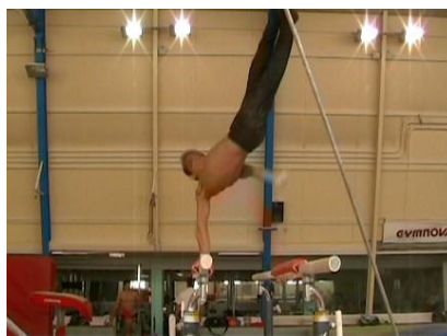
Figure 14 : L'entraîneur D placé dans le prolongement des barres utilise celles-ci pour localiser le placement des pieds du gymnaste

Outre leurs propriétés topologiques, les PP présentent pour les entraîneurs des propriétés géométriques. Des formes corporelles se dessinent telles que des lignes, des angles, des courbes auxquelles ils attribuent une orientation en référence à l'orientation naturelle du corps ; par exemple, les courbes nommées avant et arrière se distinguent par la surface courbe en creux qui se présente à l'avant ou à l'arrière du corps.