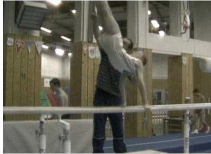
Figure 23 : l'entraîneur l pointe du doigt les pointes de pieds du gymnaste