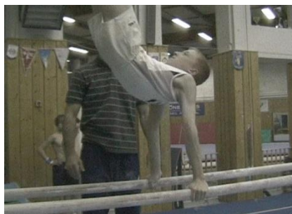
Figure 13 : Phase de placement en balancé avant

Les PP font l'objet d'un enseignement rigoureux de la part des entraîneurs. Il s'agit pour eux d'optimiser (parfois en agissant directement sur le corps du gymnaste) la mise en trajectoire du corps vers la séquence transitoire suivante. Cette fonction d'articulation spatio-temporelle entre deux PP suppose des ajustements fins qui reposent sur l'engagement sensori-moteur des entraîneurs. Ainsi, l'entraîneur D, après avoir manipulé un gymnaste pour lui montrer et lui faire sentir une PP particulière, lui demande de l'intégrer au sein de la réalisation globale de l'habileté. Son intervention