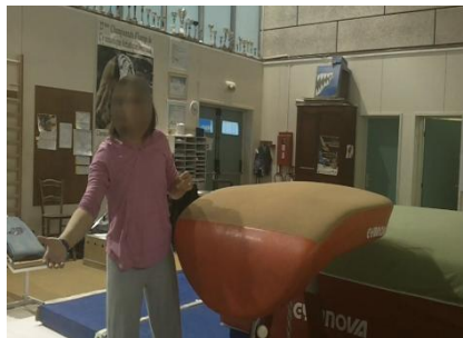
Figure 27 : la main droite anticipe l'accompagnement du gymnaste et participe de l'environnement de pratique du gymnaste

L'explicitation par l'entraîneur N de l'expérience que font les gymnastes de sa main, qui s'apprête à accompagner le corps dans son renversement au saut, révèle ce changement de perspective : « Des fois rien que le fait de mettre ma main, ça leur fait rentrer le ventre ; des fois rien que le fait de voir la main » (Figure 27).