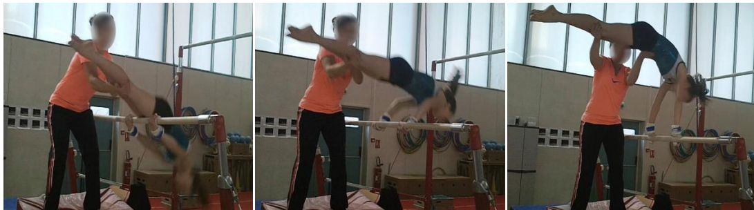
Figures 20, 21 et 22 : Etapes d'intervention de l'entraîneur O au cours du passément filé aux barres asymétriques

motrices nécessaires à la dynamique du mouvement : « Pousse sinon tu vas finir sur la tête si je t'aide pas » Entraîneur P (Flip arrière au sol). Elle vise à accompagner les déplacements transitoires initiés par le gymnaste en exerçant, par un dosage savant, des forces de poussée , de projection , de tirage , de soutien et une succession temporelle savamment orchestrée ( ralentir, accélérer, retarder, prolonger ) avec des variations d'intensité. Cet accompagnement consiste pour l'entraîneur O à saisir les jambes de la gymnaste dans la dynamique de la réalisation d'une PP (Figure 20) pour « la pousser vers le haut (Figure 21) et la stabiliser au niveau du bassin (Figure 22) ». Cette « projection « vive » des jambes vers le haut procure à la gymnaste de la vitesse et facilite l'action d'ouverture des bras ».