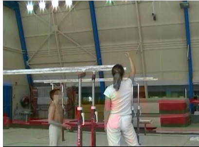
Figure 28 : l'entraîneur forme avec sa main et des doigts la forme du corps que le gymnaste doit adopter

gymnastes certaines qualités de leur production motrice et leur proposer des voies de remédiations. Ces démonstrations manuelles présentent des formes géométriques, l'articulation métacarpo-phalangienne offrant la possibilité de représenter la jonction mécanique entre le haut et le bas du corps. Les doigts peuvent former des arrondis pour rendre compte de courbes (Figure 28), ou des lignes pour rendre compte de l'effacement ou de l'affirmation d'angles inter segmentaires.