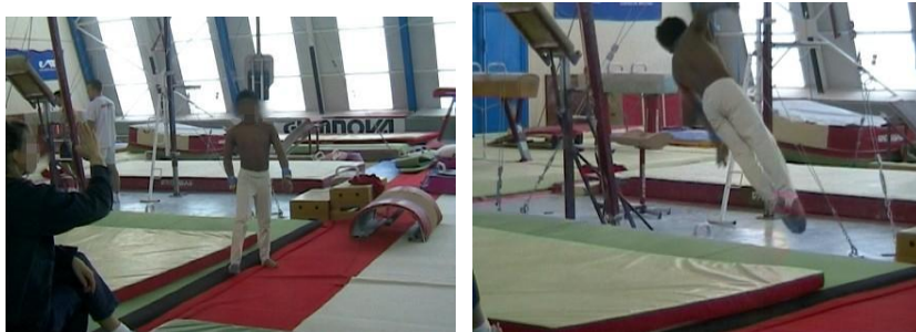
Figures 29 et 30 : l'entraîneuse, placée perpendiculairement au gymnaste en mouvement indique avec sa main la forme de corps réalisée et son orientation dans l'espace

Donnés à voir de profil, ils révèlent l'orientation spatiale privilégiée par les entraîneurs pour observer les mouvements et se rendre perceptibles les placements et déplacements dans le plan sagittal, plan largement investi par les gymnastes dans leurs mouvements sur les agrès (Figures 29 et 30).