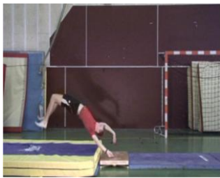
Image 1 : niveau débutant

Pour constituer le point de vue en troisième personne, le choix a été fait d'observer en différé (films et/ou photographies) le mouvement corporel pour y relever des indices macroscopiques des formes de corps (postures, positions, trajectoires, etc.), permettant de formuler des hypothèses interprétatives quant aux intentions du sujet agissant. Par exemple, pour la réalisation du saut de mains, les Images 1, 2 et 3 ci-dessous montrent la forme de corps de gymnastes de trois niveaux de performance 4 contrastés au moment précis où leurs mains quittent le sol.