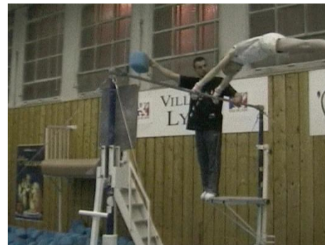
Courbe arrière ou courbe avant en arrière de la barre

Ces formules « ramassées » adressées aux gymnastes condensent un ensemble de propriétés caractéristiques de la phase qu'elles désignent. La formule lexicale « courbe avant », en se substituant à celle de « chandelle », désigne la caractéristique géométrique de la phase, le rapport de positionnement segmentaire devant dessiner une courbe , qui apparaît à l'entraîneur par l'adoption volontaire d'un positionnement de profil par rapport au gymnaste. Cette créativité sémantique révèle un appauvrissement de la perception du corps par une catégorisation qui finalement enrichit l'intelligibilité opératoire en révélant des aspects saillants du corps en mouvement générateurs potentiels de transformation : i) une catégorisation « géométrique » révélant un corps épuré segmenté en portions de droites articulées ; ii) une catégorisation « dynamique » révélant un corps consistant : « Courbe avant ! Mais qu'est-ce que tu attends, serre tes fesses ! » (Entraîneur I) ; iii) une catégorisation « topologique » révélant un corps orienté avec des faces antérieure et