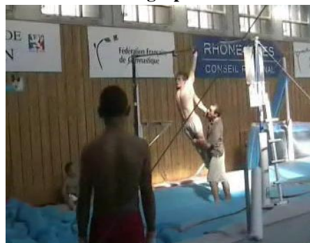
Phase d'extension du soleil

L'intervention verbale de l'entraîneur, en associant une intention de sensation et un objet à sentir dans une phase de placement, révèle la difficulté de clarifier des propriétés sensorielles qui ont un caractère privé et corporellement ancré. Cette difficulté apparaît dans les explicitations de l'entraîneur K concernant le guidage des intentions praxiques lors de la phase de descente du soleil qui nécessite une action de résistance sur la barre (propriété dynamique) afin de conserver une posture en courbe (photographie 6) sans que les épaules ne chutent (propriété géométrique) :