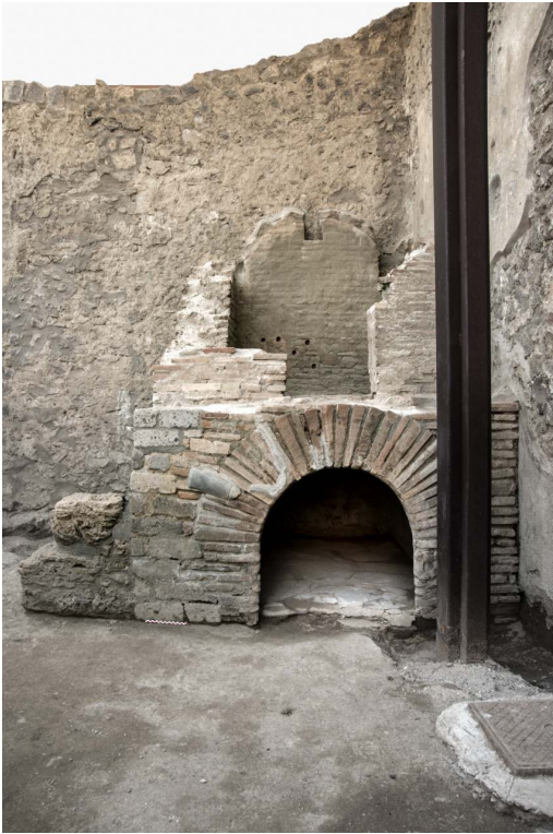
Fig. 5 – Petit four