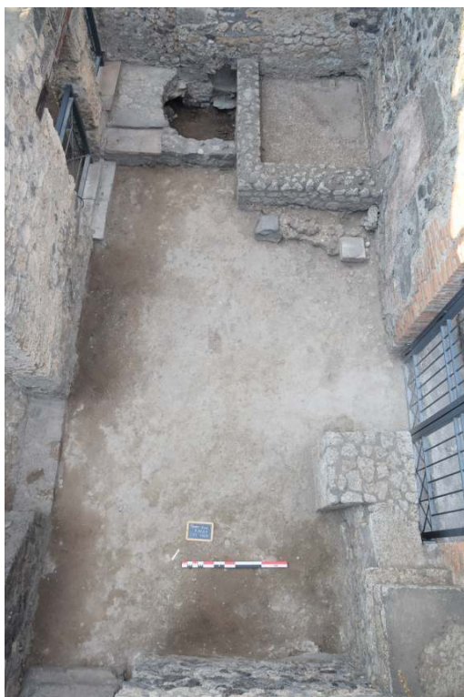
FIG. 3 – ESPACE 1 AVEC LE BASSIN, LA FOSSE SEPTIQUE ET LE COMPTOIR DE VENTE.

vendait. La production de l'atelier de potier ? le vin produit dans le jardin, en vente au détail ?