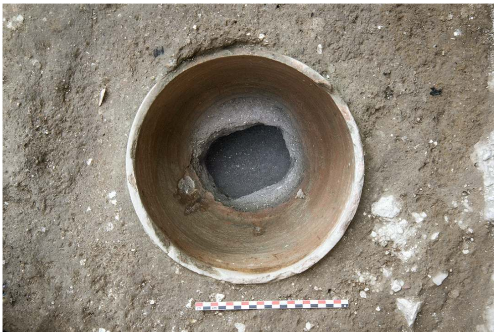
Fig. 4 – DÉTAIL DE L'EMPLACEMENT DE L'AXE DU TOUR DE POTIER

négatif de l'emplacement de l'axe de maintien du tour de potier. La forme de la cavité, quadrangulaire, indique clairement qu'il s'agit d'un tour à axe fixe (fig. 4).