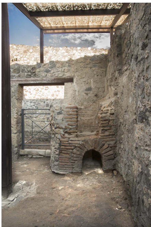
Fig. 6 – Grand four (cliché Ch. Durand, Aix Marseille Univ, CNRS, MCC, CCJ)