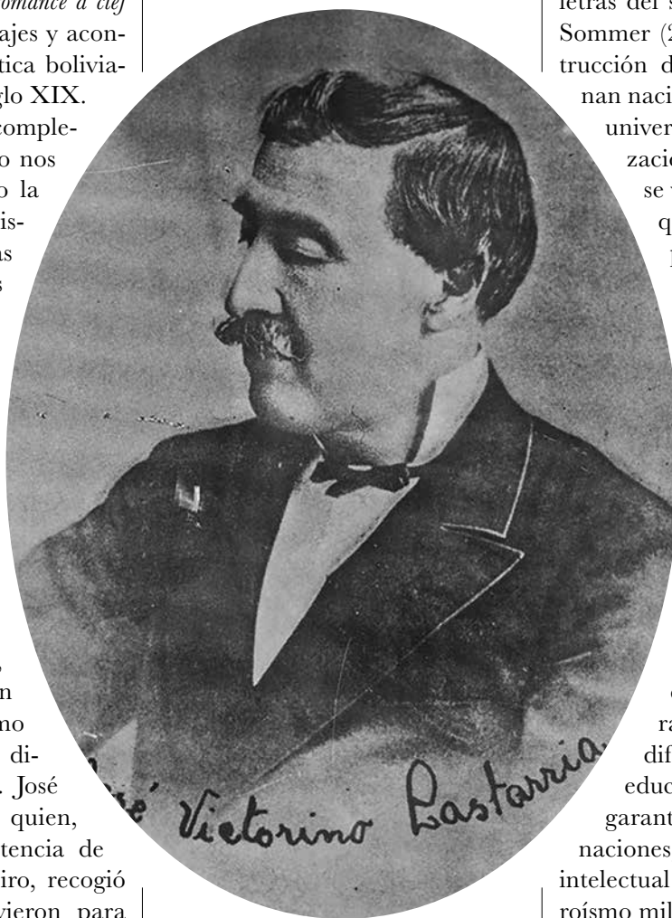
José Victorino Lastarria.