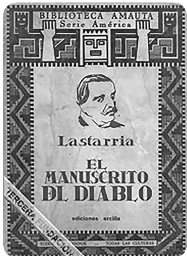
Portada de El manuscrito del diablo de José Lastarria.