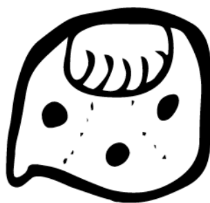
Fig. 5. Un glyphe d'Ix le jaguar, selon le calendrier Tzolkin (Maya).

de noms mayas des jours et d'étoiles ; poétique du Divers dirait Glissant ;