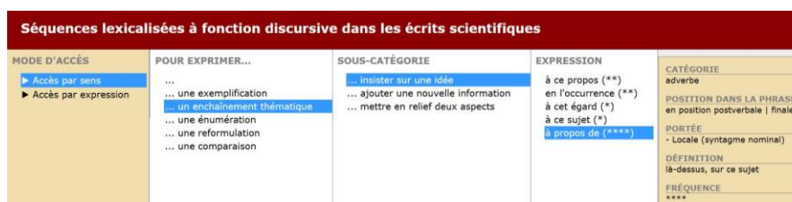
Copie d'écran 2 : Entrée sémasiologique de à propos de dans DiCorpus

Sur la copie d'écran 2 on distingue les fréquences des éléments dans le corpus ce qui donne un aperçu de leur utilisation dans le champ scientifique (ici on voit que à propos de est fréquent avec 4*).