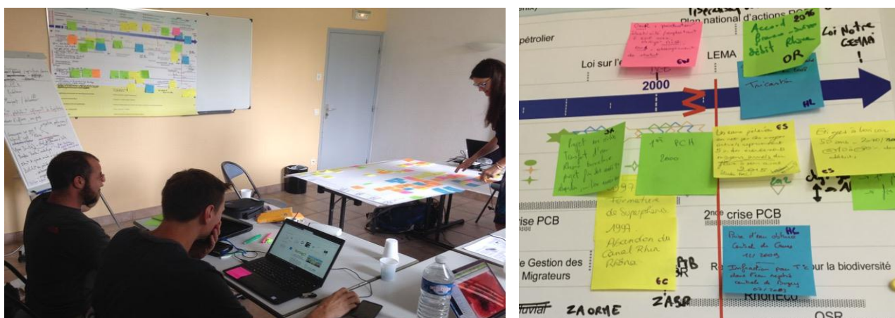
FIGURE 3. Atelier chercheurs-gestionnaires (Yenne, juillet 2018)

Fin 2017, le projet CHRONO-RHÔNE a été monté afin de répondre aux questions posées. Un atelier participatif de deux jours a été organisé en juillet 2018. Il a réuni cinq chercheurs de différentes disciplines (géographie sociale, histoire, géomorphologie, éco-hydrologie, géochimie) ainsi que la représentante de l'Agence de l'Eau RMC, la directrice du Syndicat du Haut-Rhône, l'administratrice des données de l'OHM VR et l'animateur scientifique de l'OHM VR. Le collectif a révisé et complété les différents thèmes d'évènements marquants de la frise (bandeaux horizontaux blancs) et a dressé un premier paysage des tendances temporelles d'évolution des objets de recherche (bandeaux horizontaux jaunes, parmi lesquels : biologie, morphologie, flux sédimentaires, discours/controverses) (Figure 3). Une attention particulière a été portée pour décrire les évènements individuellement, sans liens de causalité. Ces liens pourront être rajoutés par la suite, mais nous envisageons aussi de ne pas en mettre et de laisser l'utilisateur (gestionnaire ou chercheur) libre de manipuler les bandeaux et de mettre en évidence des liens qui n'avaient pas été identifiés au départ. De nouvelles mises en relation ou questions de recherche pourraient ainsi émaner de l'exploitation de la frise.