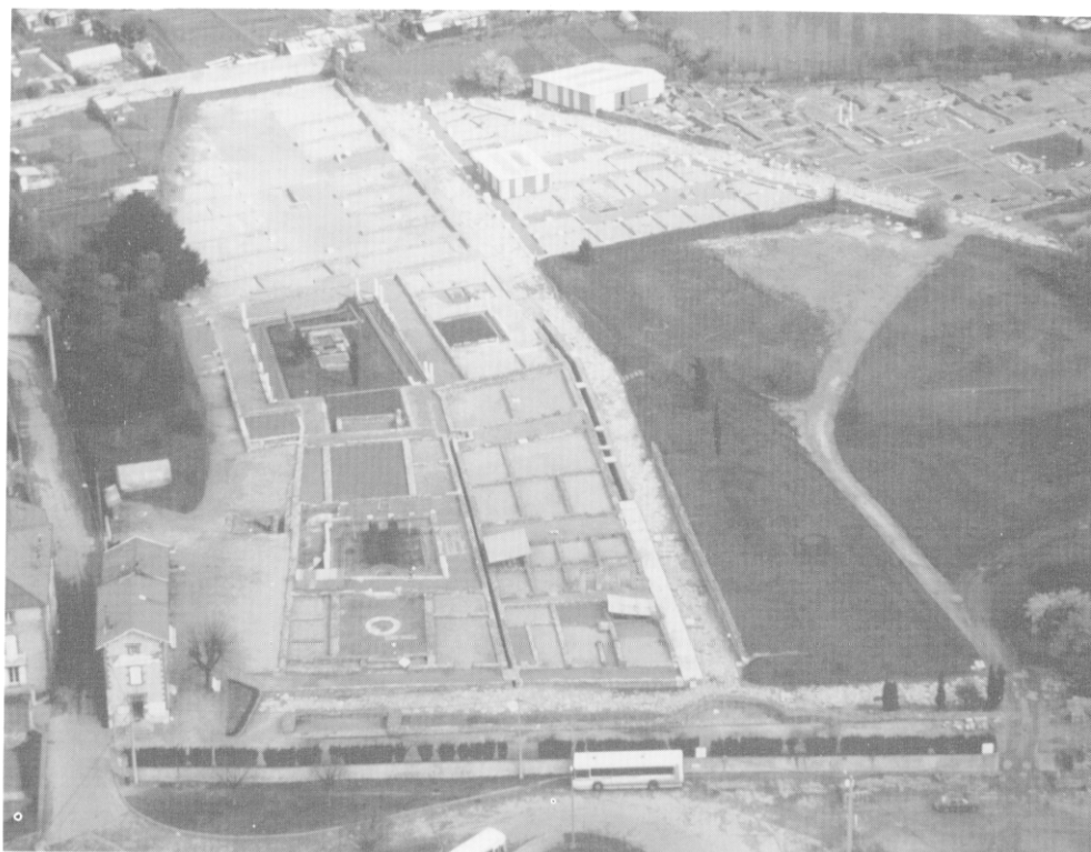
Fig. 3 — Vue générale de l'îlot A depuis le sud.