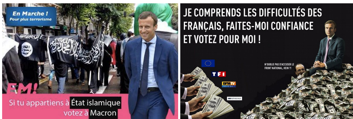
Exemple de « memes » ayant circulé pendant la campagne présidentielle, l'un destiné au fillonnistes, l'autre aux mélenchonistes.

Leur plan d'attaque : mener une campagne de dénigrement et de désinformation massive visant Emmanuel Macron. Ce plan est accompagné de conseils quant à ce qui horripile ou fait peur aux différentes communautés politiques françaises pour mieux mettre en œuvre les techniques de manipulation de l'opinion. Les deux principales cibles : Les Républicains , qu'il est conseillé d'aborder sous l'angle de l'immigration et de la peur du terrorisme ; et les Insoumis , qu'il est conseillé d'approcher sur le thème du rejet de la finance, des élites et de l'Europe néolibérale. L'objectif est toujours le même : qu'ils s'abstiennent ou votent Le Pen au second tour.