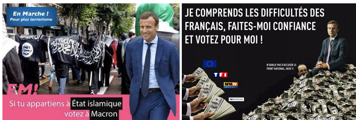
Exemple de « memes » ayant circulé pendant la campagne présidentielle, l'un destiné au fillonnistes, l'autre aux mélenchonistes.

Leur plan d'attaque : mener une campagne de dénigrement et de désinformation massive visant Emmanuel Macron. Ce plan est accompagné de conseils quant à ce qui horripile ou fait peur aux différentes communautés politiques françaises pour mieux mettre en œuvre les techniques de manipulation de l'opinion. Les deux principales cibles : Les Républicains , qu'il est conseillé d'aborder sous l'angle de l'immigration et de la peur du terrorisme ; et les Insoumis , qu'il est conseillé d'approcher sur le thème du rejet de la finance, des élites et de l'Europe néolibérale. L'objectif est toujours le même : qu'ils s'abstiennent ou votent Le Pen au second tour.