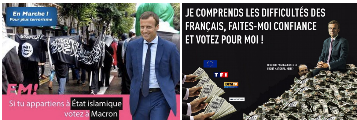
Exemple de « memes » ayant circulé pendant la campagne présidentielle, l'un destiné au fillonnistes, l'autre aux mélenchonistes.

Leur plan d'attaque : mener une campagne de dénigrement et de désinformation massive visant Emmanuel Macron. Ce plan est accompagné de conseils quant à ce qui horripile ou fait peur aux différentes communautés politiques françaises pour mieux mettre en œuvre les techniques de manipulation de l'opinion. Les deux principales cibles : Les Républicains , qu'il est conseillé d'aborder sous l'angle de l'immigration et de la peur du terrorisme ; et les Insoumis , qu'il est conseillé d'approcher sur le thème du rejet de la finance, des élites et de l'Europe néolibérale. L'objectif est toujours le même : qu'ils s'abstiennent ou votent Le Pen au second tour.