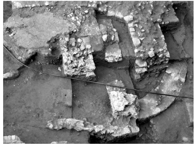
Fig. 63 – Limoges (Haute-Vienne). L'autel et l'abside semi-circulaire ajoutés à l'est du baptistère.

La découverte du baptistère de Limoges vient donc compléter le corpus de ces édifices « singuliers et précieux » (Guyon, 2000, p. 67). Si le plan hexagonal utilisé ici s'avère extrêmement peu fréquent, non seulement en Gaule mais aussi dans l'ensemble de l'Empire, l'emploi d'un plan centré reste cependant la caractéristique de très nombreux baptistères. Mais le baptistère de Limoges se démarque également par un plan que l'on pourrait qualifier de rayonnant, avec l'utilisation d'absides extrêmement prononcées. Pour autant, pour ce dernier caractère, plusieurs rapprochements avec quelques édifices connus peuvent être établis en Gaule, mais également en Italie du Nord. À ce titre, le baptistère de Nevers, bien que basé sur un module octogonal, est très certainement le moins éloigné de celui de Limoges, mais les absides y alternent en plan quadrangulaire et en plan semi-circulaire. À Louin, un mausolée fouillé en 1898 et daté du IV e s. possède un plan hexagonal, avec des absides prononcées alternant, comme à Nevers, plan quadrangulaire et plan semi-circulaire (Duval, 1990). Sans présumer des découvertes futures (à Bourges et Clermont-Ferrand, notamment), il faudra peut-être s'interroger sur la possibilité d'un « type » de baptistère commun à la Gaule centrale, de la même manière que les baptistères provençaux présentent entre eux de fortes analogies (Guyon, 2000, p. 30).