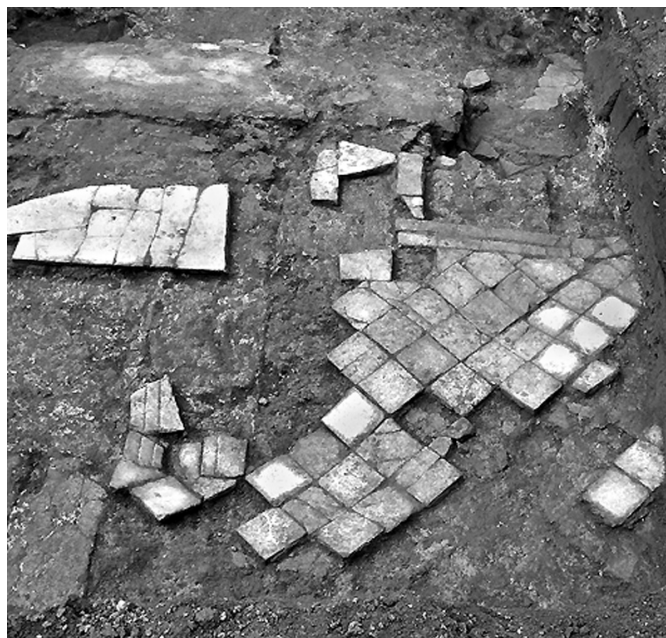
Fig. 58 – Arles (Bouches-du-Rhône). Église de l'enclos Saint-Césaire : détail du pavement de marbre du synthronos.

Ces travaux ont mis en évidence l'existence d'une vaste abside en petit appareil, d'une emprise de près de 20 m et