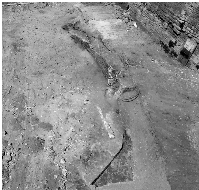
Fig. 57 – Arles (Bouches-du-Rhône). Église de l'enclos Saint-Césaire : vue de l'ensemble du chevet au début de la campagne 2004.

dans le monastère féminin Saint-Jean que fonde Césaire au début de son épiscopat, et qui est resté le couvent Saint-Césaire jusqu'à la Révolution (Benoit, 1951; Heijmans, 2004a, p. 263-270 et p. 281-291).