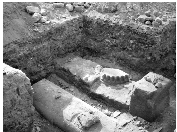
Fig. 60 – Arles (Bouches-du-Rhône). Église de l'enclos Saint-Césaire : vue des vestiges découverts par F. Benoit en 1943 dans le jardin de l'asile.

Quant à la datation de l'édifice, la fouille n'a pour l'instant concerné que les niveaux postérieurs à sa construction, voire à son abandon et sa démolition. Les sondages réalisés en 2004 en plusieurs endroits à l'extérieur du chevet ont montré la présence de remblais importants, parfois sur plusieurs mètres de hauteur, datables des V e -VI e s., sur lesquels sont directement aménagés les niveaux