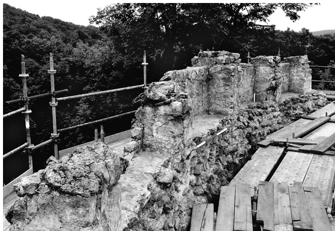
Fig. 41 – Saint-Bertrand-de-Comminges (Haute-Garonne). Vue prise de l'angle sud-ouest des vestiges du couronnement de l'enceinte.

L'élévation, la muraille proprement dite, en assises de moellons calcaires rythmées par des lits de briques, est large de 1,70 m. Des ressauts sont aménagés sur la face interne. Un enduit en mortier blanchâtre, revêtu de lait de chaux, a été observé dans les sondages pratiqués sur la face interne du rempart, et des traces en subsistent sur la face externe. Il recouvrait les parements, cachant ainsi les irrégularités de construction et donnant à l'ouvrage une allure monumentale. Au sommet de l'élévation se trouve une banchée de mortier rose qui marque le passage au couronnement