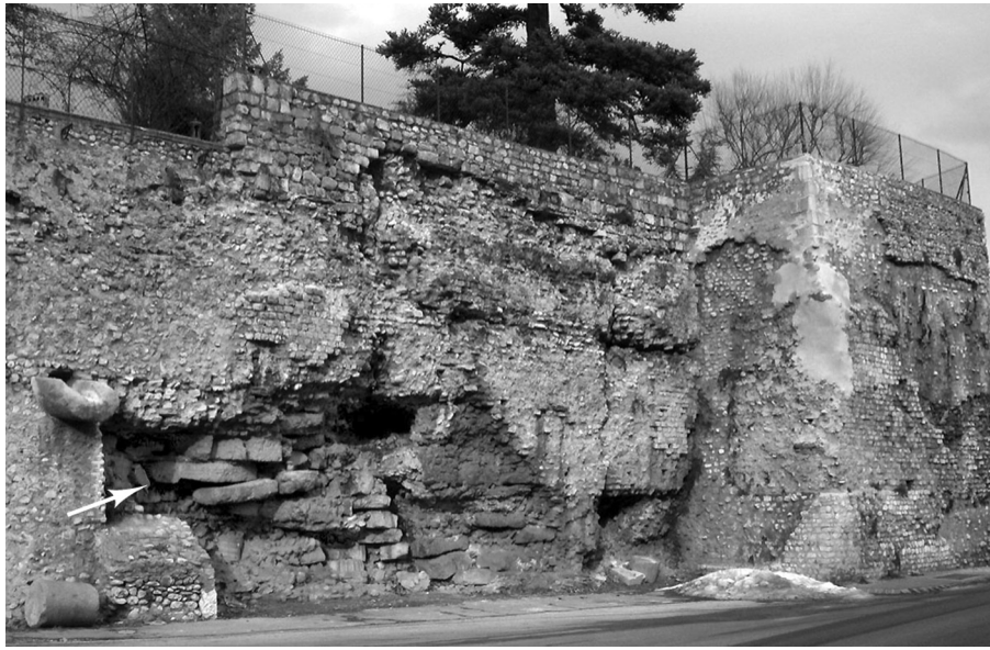
Fig. 39 – Die (Drôme). Dalles de rue en emploi à la base d'une courtine.

les thermes monumentaux de Pluviane, sur un plateau opposé à la ville par rapport au ravin de la Meyrosse; au sud, un quartier d'habitation qui occupait la terrasse inférieure; à l'ouest, l'esplanade monumentale du Pallat, que l'on devine bordée d'édifices de prestige comme le laisse supposer la base de colonne en marbre blanc de 1,60 m de côté qui y a été retrouvée en 1976. En outre, un sondage réalisé en 1997 rue Terrot, à l'est de la ville, a montré que l'enceinte a été implantée à l'emplacement d'un bâtiment préexistant, vraisemblablement une habitation, sans qu'il soit cependant possible de déterminer si celle-ci a été démolie pour l'occasion ou s'il n'en subsistait que des ruines lors de l'édification du rempart (Planchon, 2004c, p. 50). Les observations réalisées au Pallat entretiennent ce doute : l'esplanade monumentale mise au jour lors de la fouille de 1998 est en effet abandonnée dès la fin du II e s.; dans le courant du III e s., les dalles de cet espace et une partie des élévations sont déjà récupérées et un fossé, creusé durant cette phase, est utilisé comme dépotoir et comblé dès la seconde moitié du III e s. (Planchon, 1998, p. 20).