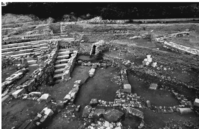
Fig. 18 – Aix-en-Provence (Bouches-du-Rhône). Vue des murs tardifs construits sur les gradins de la cavea du théâtre antique. Photo prise depuis le sud-est.

Si les vestiges laissent peu ou prou se dessiner les modalités d'occupation du théâtre, il est en revanche impossible d'établir le moment où ce dernier a perdu sa fonction d'édifice de spectacle. Grâce au très abondant mobilier exhumé des sols d'occupation, nous savons que la transformation du monument en quartier d'habitat remonte au moins au milieu du V e s. apr. J.-C., ce qui ne constitue pas, pour l'heure, un terminus ante quem . Nous savons, d'autre part, que cette occupation a été précédée par une (première ?) phase de démantèlement, au cours de laquelle nombre d'éléments architecturaux ont été prélevés sur l'édifice antique (fig. 19). En attestent la présence, dans les maçonneries établies à même l' orchestra , qui appartiennent à la séquence la plus ancienne, de blocs architectoniques qui ont probablement appartenu au bâtiment de scène, ainsi que l'installation des premiers sols en terre battue non sur l'habillage en marbre de la proédrie, mais sur son soubassement en béton. Il est de fait difficile de dire dans quel état se trouvait le théâtre au moment de sa colonisation comme quartier d'habitat et quel fut éventuellement le laps de