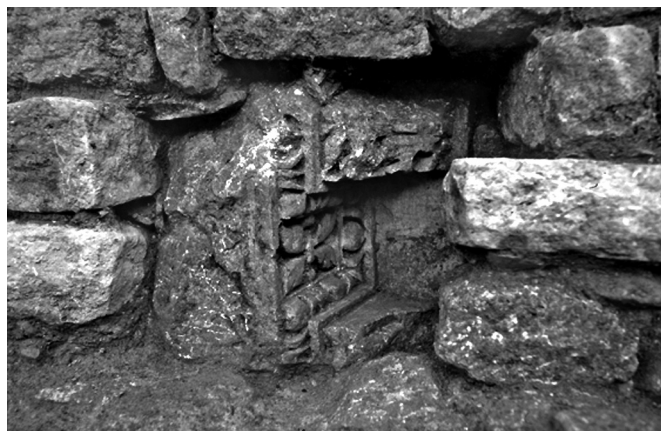
Fig. 19 – Aix-en-Provence (Bouches-du-Rhône). Vue d'un bloc de corniche en remploi dans la maçonnerie d'un mur de l'Antiquité tardive établi sur le sol de l'orchestra du théâtre antique.

Si les vestiges laissent peu ou prou se dessiner les modalités d'occupation du théâtre, il est en revanche impossible d'établir le moment où ce dernier a perdu sa fonction d'édifice de spectacle. Grâce au très abondant mobilier exhumé des sols d'occupation, nous savons que la transformation du monument en quartier d'habitat remonte au moins au milieu du V e s. apr. J.-C., ce qui ne constitue pas, pour l'heure, un terminus ante quem . Nous savons, d'autre part, que cette occupation a été précédée par une (première ?) phase de démantèlement, au cours de laquelle nombre d'éléments architecturaux ont été prélevés sur l'édifice antique (fig. 19). En attestent la présence, dans les maçonneries établies à même l' orchestra , qui appartiennent à la séquence la plus ancienne, de blocs architectoniques qui ont probablement appartenu au bâtiment de scène, ainsi que l'installation des premiers sols en terre battue non sur l'habillage en marbre de la proédrie, mais sur son soubassement en béton. Il est de fait difficile de dire dans quel état se trouvait le théâtre au moment de sa colonisation comme quartier d'habitat et quel fut éventuellement le laps de