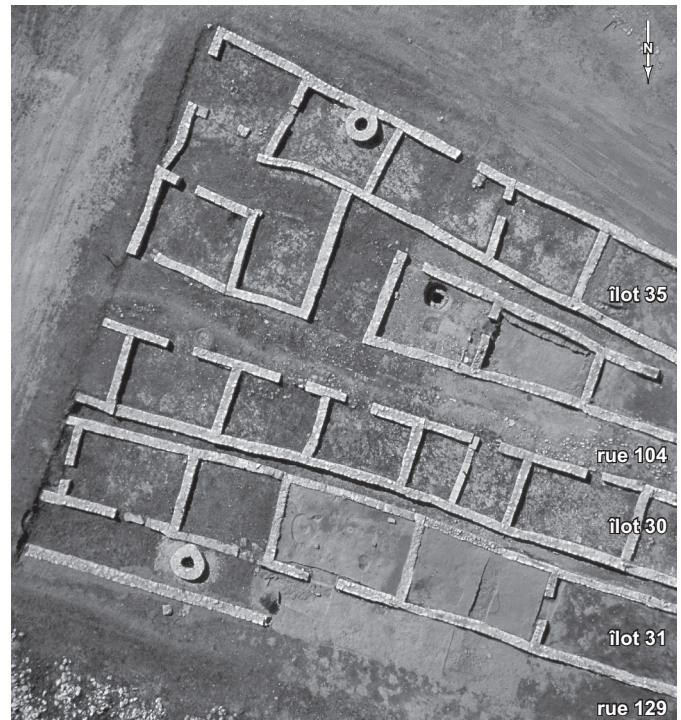
Fig. 91 – Vue aérienne des îlots 30, 31 et 35 de Lattara montrant la convergence des axes de l'urbanisme vers l'ouest.

On leur opposera les demeures plus grandes, munies d'une cour intérieure ou latérale enclose dans le bâti, de surface nettement supérieure, dont on a présenté ci-dessus quelques exemples (voir Dietler et al. , supra , p. 111-122). Ces maisons à cour entrent dans une catégorie (groupe 5 de Py, 1996a, p. 235) de mieux en mieux illustrée sur le site de Lattes, alors même que les parallèles régionaux avérés restent fort rares (fig. 92). Il est en tout cas patent que leur apparition au cours du III e s. av. J.-C. concrétise dans l'habitat une différenciation qui auparavant ne s'y voyait pas. L'idée n'est pas, en l'occurrence, que les périodes antérieures ne connaissent pas dans ce domaine de stratification : un habitat apparemment égalitaire – en termes de surface, de plan, d'aménagements, d'équipement mobilier – peut en effet masquer bien des différences dans la condition de ceux qui l'habitent ; mais plus précisément que ces différen-