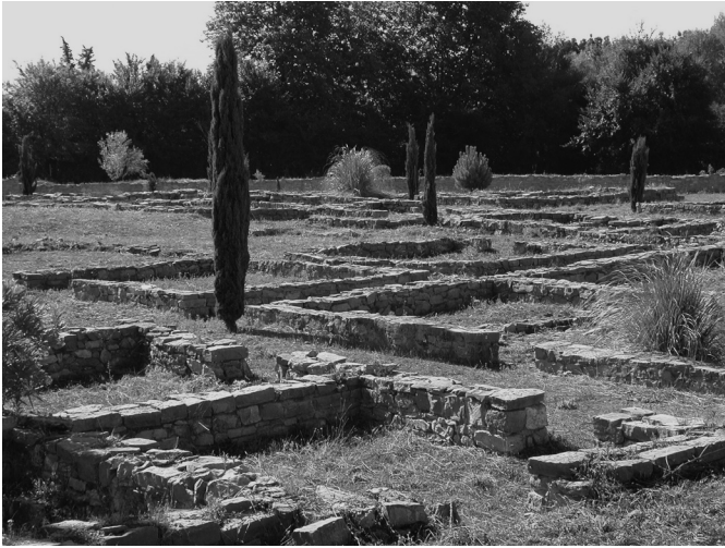
Fig. 88 – Les quartiers urbains au centre de la cité protohistorique de Lattara (vue prise du nord-est).

partout dans le Midi (notamment dans la région nîmoise), sans que l'on sache encore exactement répondre.