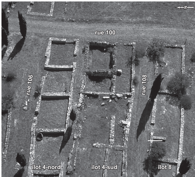
Fig. 90 – Alternance d'îlots simples et d'îlots doubles dans le noyau central de la ville ancienne de Lattara, séparés par des ruelles-drains et des rues secondaires parallèles à la rue principale 100.

fin du V e s. av. J.-C., selon un module moyen tournant autour de 50-60 m 2 par lot. La perdurance de ce module jusqu'au I er s. av. J.-C. a été largement reconnue dans plusieurs zones de la ville (Py, 1996a) : ainsi pour les III e -II e s. av. J.-C. dans les îlots 1, 2, 4-sud, 7, 8, 16 et 31, et pour le I er s. av. J.-C. dans les îlots 4-nord, 30 et 35. Les maisons de taille réduite bâties dans ces lots, comprenant entre 1 et 4 pièces, avec ou sans espace extérieur privatisé, correspondaient certainement aux habitations ordinaires des Lattois, sinon obligatoirement aux habitations des Lattois ordinaires.