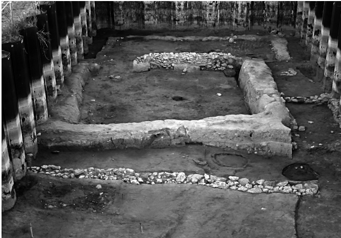
Fig. 77 – Soubassements en bauge et en pierre d'une maison du milieu du V e s. av. J.-C. dans la zone 1 de Lattes (cliché : E. Gaillardat, CNRS).

soubassement se limite alors à une partie bien spécifique du bâtiment, sur un mur ou un tronçon de mur d'une maison, généralement pour renforcer le piédroit d'une ouverture ou une tête de mur. En revanche, les élévations sont le plus souvent bâties en briques crues (Roux, à paraître). Ce mode de construction se rencontre encore couramment au premier quart du IV e s. av. J.-C. dans des maisons indépendantes ou associées à d'autres maisons en pierre et adobe au sein d'un même îlot (Roux, 1999, p. 15 et p. 32-35). On assiste ensuite à un progressif abandon de cette technique, les constructions postérieures au milieu du IV e s. av. J.-C. utilisant désormais principalement une architecture mixte comprenant un soubassement en pierres liées à la terre surmonté d'une élévation en adobes (Chazelles, 1996, p. 259-328).