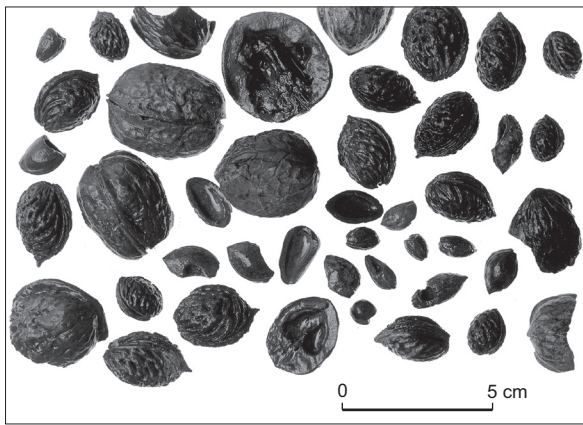
Fig. 128 – Échantillon de restes de fruitiers conservés par imbibition dans un puits de la zone 129 de Lattes (PT129011, Us 129024).

cultivés et cueillis pour les périodes les plus récentes du site (Buxó, 2005). Des noix ( Juglans regia ), des noisettes ( Corylus avellana ), des pignons ( Pinus pinea ), des cerises douces ( Prunus avium ) et aigres ( Prunus cerasus ), deux variétés de prunes ( Prunus domestica subsp. institia var. subrotunda , « prunes rondes », et P. domestica subsp. institia var. juliana , prune crêpe), des pêches ( Prunus persica ), des prunelles ( Prunus spinosa ), des raisins et des olives y ont été collectés.