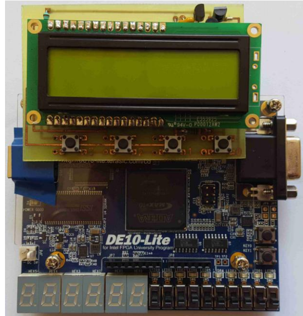
fig 3 : Carte PPGA DE10-Lite associée à la carte d'extension

du prix soit environ 25€ par carte. Pour pouvoir utiliser cette carte sans changer le projet, une carte d'extension a été réalisée afin de pouvoir ajouter un écran LCD et 4 boutons poussoirs (voir fig 3). 20 cartes DE10-Lite ont été achetées et 20 cartes d'extension ont été réalisées afin de pouvoir prêter 1 ensemble carte DE10-Lite + carte d'extension par binôme durant le temps du projet.