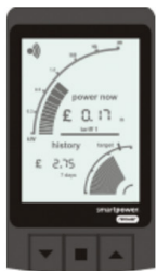
Figure 1: Dispositifs de Feedback énergétique. De haut en bas : UK British Gaz, eKo, eOn chameleon, N power.