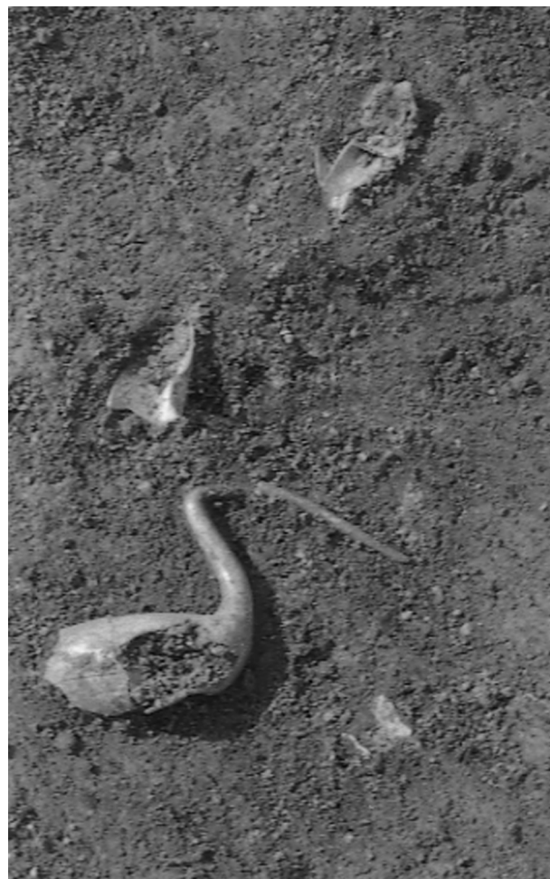
Fig. 1.- Photographie de l'oiseau encore en place sur le terrain.

Des éléments apparemment semblables sont conservés au musée Borely de Marseille (11).