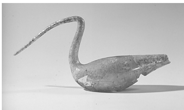
Fig. 3.- Photographie de l'oiseau reconstitué.

Un contenant aviforme, conservé au Musée du Louvre, provient d'Italie et est daté du IV e siècle (16).