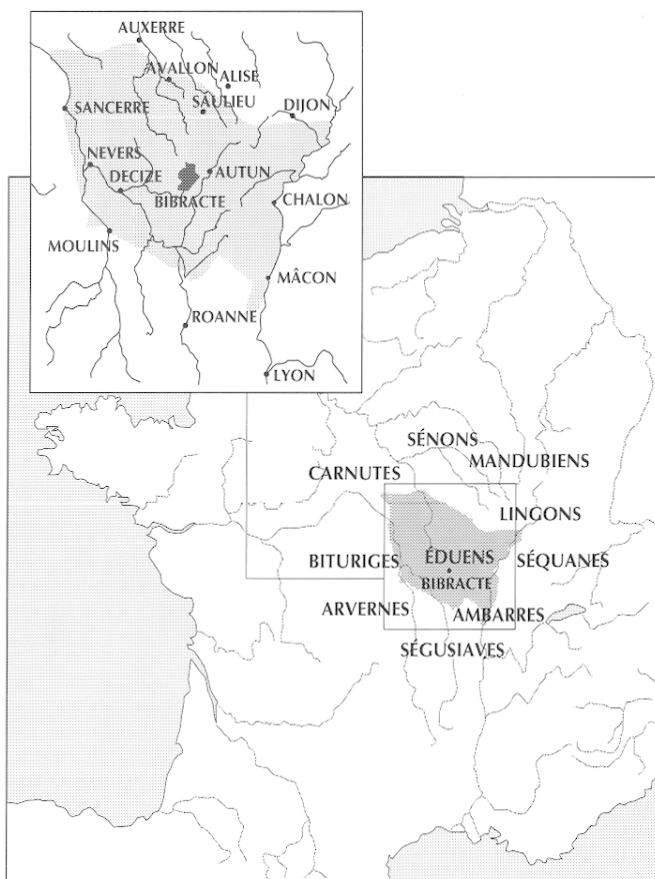
Fig. 1 – Localisation de Bibracte et du territoire supposé des Éduens au moment de la conquête romaine.

Cicéron, lors de son ambassade de 61 avant J.-C. Il ne fait nul doute que de tels contacts aient contribué à l'évolution du mode de vie des habitants de la capitale éduenne.