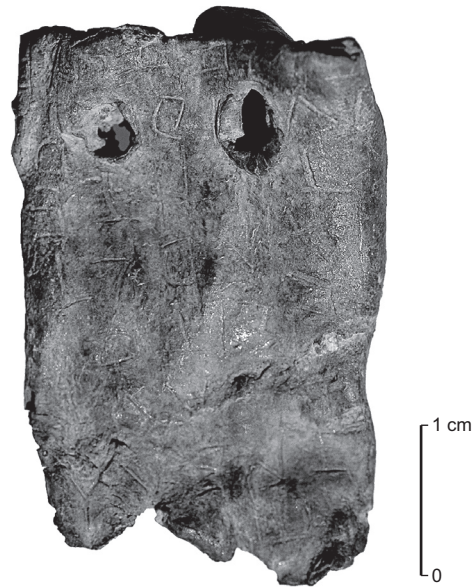
Fig. 131 – Plaque de plomb percée avec des inscriptions en grec provenant de la zone 27 de Lattes (Us 27849, vers 425 av. J.-C.).

Ce que l'on croit percevoir et qui demandera également confirmation, c'est l'existence à la suite de la phase étrusque – dont on a l'impression, dans l'état actuel des données, qu'elle se termine brutalement –, d'une phase de relatif flottement, marquée dans l'architecture militaire par des réfections ponctuelles et localement grossières, et dans l'architecture civile par le retour à des solutions tradition-