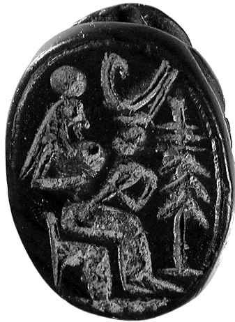
Fig. 130 – Scarabée égyptien figurant Isis allaitant Pharaon enfant, coiffé de la double couronne, provenant d'un niveau du milieu du V e s. av. J.-C. de l'îlot 1 de Lattes (Us 53060). Sans échelle.

Échelle historique et sociologique enfin, sur tous ces aspects et sur d'autres, suscités par quelques découvertes significatives : on pense notamment à la confirmation archéologique extrêmement convaincante de l'installation de négociants venus d'Étrurie aux origines de la cité ; aux questions posées par la découverte d'une statue archaïque de guerrier d'une rare qualité plastique, témoignant de multiples influences iconographiques à l'échelle de la Méditerranée occidentale ; aux interrogations posées par la mise au jour d'un scarabée égyptien dans un niveau du V e s. de l'îlot 1 (fig. 130) ; aux questions sociales soulevées par la fouille de grandes demeures à cour des III e -II e s. av. J.-C. rompant avec les traditions de l'habitat indigène ; aux questions économiques, mais aussi culturelles, posées par la découverte d'un nouveau trésor monétaire de la fin du III e s. av. J.-C. et par l'étude exhaustive des monnaies pré-romaines recueillies sur le site, une fois celles-ci intégrées dans le contexte des circulations monétaires de Gaule méridionale.