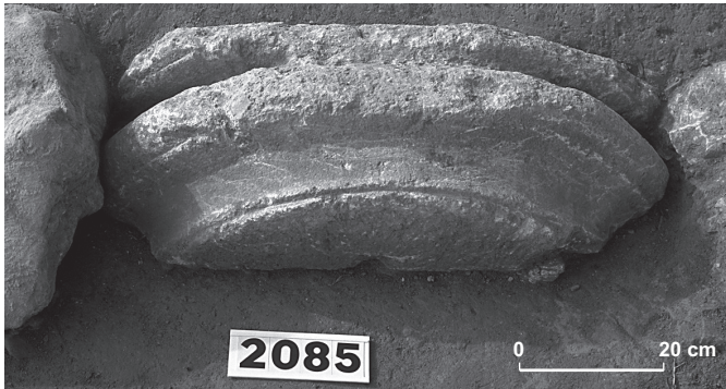
Fig. 133 – Base de colonne corinthienne (SB26152) en réemploi en bordure d'un hangar du port de Lattes, témoin de l'existence de monuments publics sur le site au 1 er s. av. J.-C..

malgré tout à travers elles des transformations majeures du cadre urbain, que concrétisent au centre de l'ancienne cité, dans la zone 60, la construction d'une vaste domus et la création d'une place triangulaire bordée de bâtiments parfois importants mais dont la vocation reste indéfinie. Ces transformations sont également très nettes sur la façade méridionale, en liaison avec le vaste programme de construction concernant le port et ses abords : la porte P2 de l'enceinte est restructurée ; d'autres passages sont apparemment percés ; les voies d'accès sont réorganisées ; la terrasse portuaire est profondément remodelée avec une reconstruction des quais, l'édification d'un probable phare et de grands hangars à dolia ; des portions d'enceinte sont englobées dans une mise en gradins obtenue par de puissants murs de soutènement ; les zones de stockage sont étendues jusqu'à l'intérieur de la ville et le long de la façade orientale.