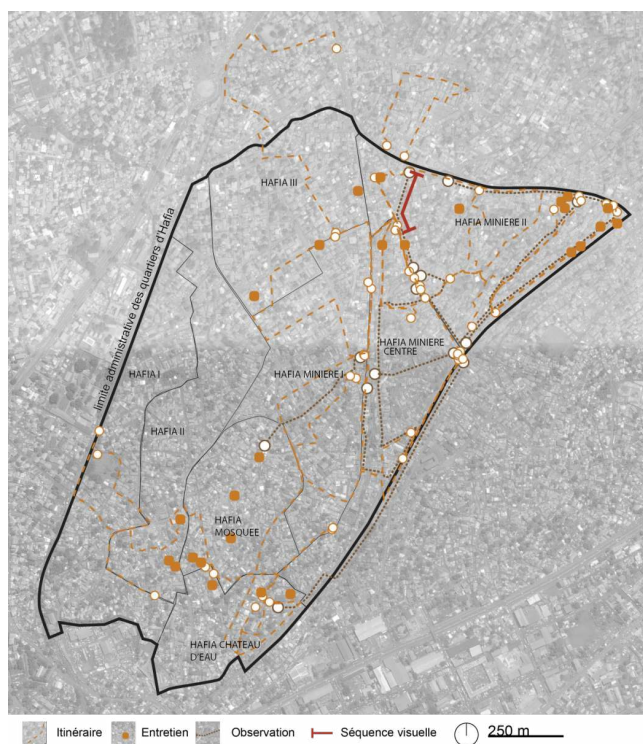
Carte 3. Représentation spatiale des enquêtes de terrain (2012-2015)