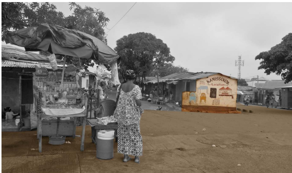
Photo1. Toponymie de l'espace, le carrefour Kamissokoya à Hafia Minière centre