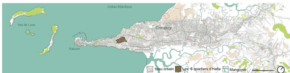
Carte 2. Conakry, localisation des quartiers populaires d'Hafia