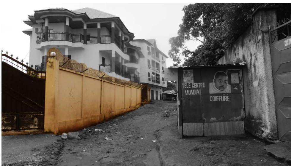
Photo 3. Un mur de clôture à Hafia mosquée