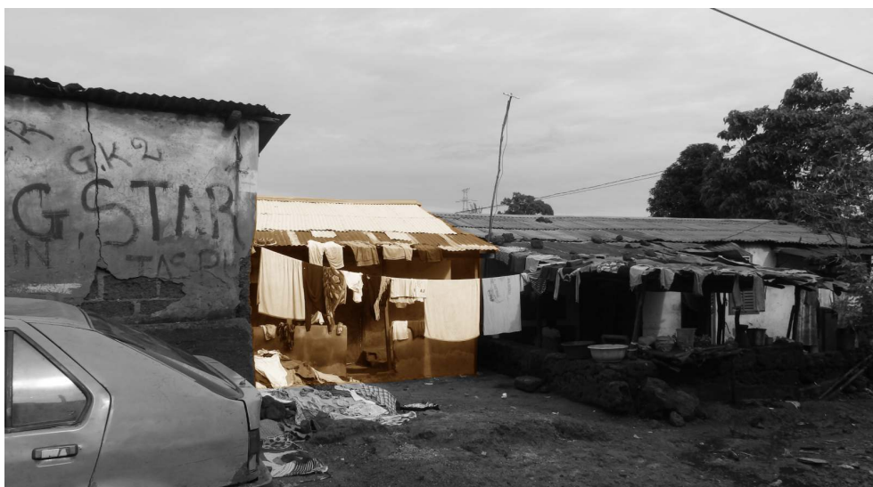
Photo 4. Fermeture des espaces à Hafía