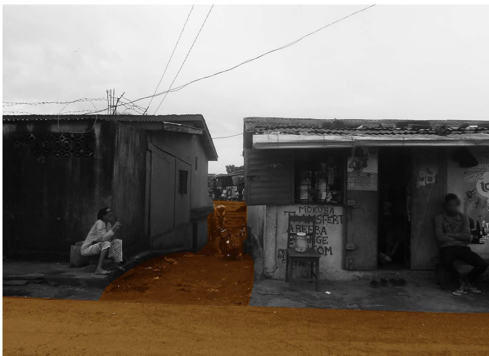
Photo 2. Un passage à Hafía