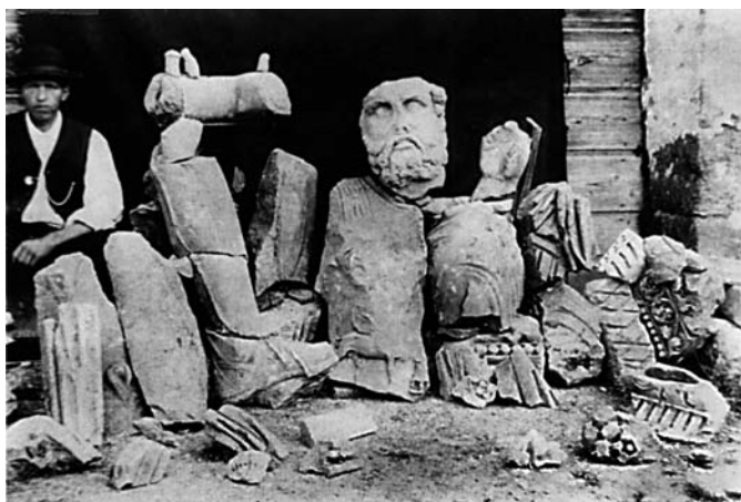
Fig. 20 – Fragments de statues et blocs d'architecture trouvés en 1889.

claudienne, tandis que l'enceinte ovale aurait été mise en place à une époque postérieure, sans doute contemporaine de la construction du théâtre, sous Domitien.