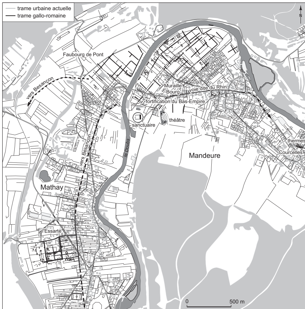
Fig. 2 – Implantation de la ville antique d'Epomanduodurum (fond de plan : D. Watts et P. Mouglin, SIVAMM, modifié par P. Barral, LCE).

ouverts, grâce au nouveau cadre réglementaire de l'archéologie préventive : la nécropole gauloise des Longues Raies et les quartiers artisanaux de l'Essarté et de Faubourg de Pont, à Mathay, furent alors explorés sur de larges fenêtres. Depuis quelques années, diagnostics et fouilles de sauvetage s'enchaînent avec régularité, touchant principalement, mais pas exclusivement, les quartiers suburbains de l'agglomération romaine.