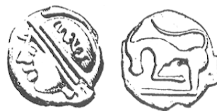
LT 5401. Séquanes