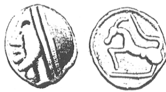
LT 5368. Séquanes