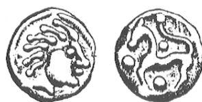
LT 7417. Sénon