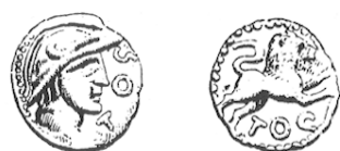
LT 5629. Séquanes