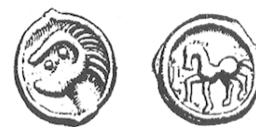
LT 7437. Sénon