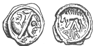
LT 8319. Lingons