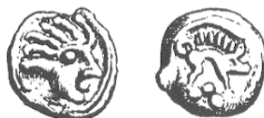
LT 7445. Sénon