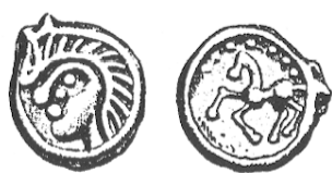
LT 7434. Sénon