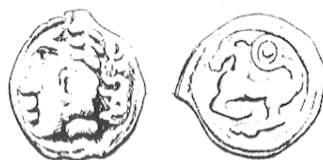
LT 5393. Séquanes