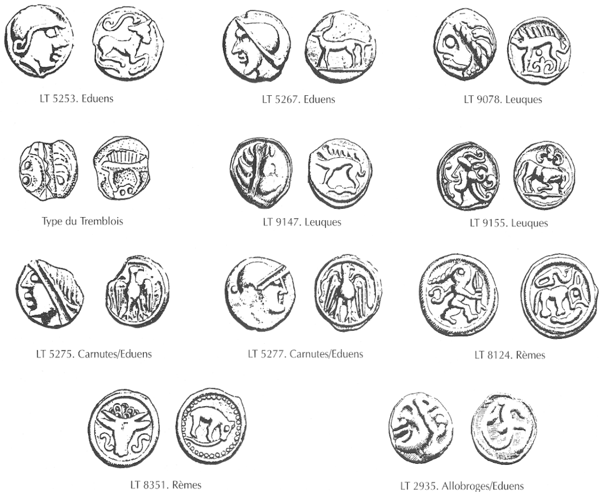
Fig.13. Types monétaires présents à Alésia (suite).

type LT XVI, 5253, un exemplaire de type XVI, 5267, deux monnaies au cou triangulaire et au quadrupède, ainsi qu'un potin non identifié 22 . Le numéraire leuque n'apparaît absolument pas dans les fouilles de Jacky Bénard. Il est présent au musée, où l'on recense douze monnaies de type LT XXXVII, 9078, onze d'entre elles présentant un aspect un peu particulier : le diadème est fait d'un zigzag en creux, au lieu d'être constitué d'une sorte de torsade. Les pièces de ce type sont nombreuses au sanctuaire du Tremblois, en forêt de Châtillon, on