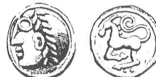
LT 5390. Séquanes