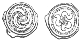
LT 8329. Lingons