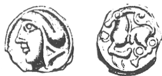
LT 5527. Séquanes