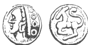
LT 5542. Séquanes