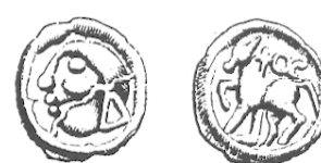
LT 5611. Séquanes