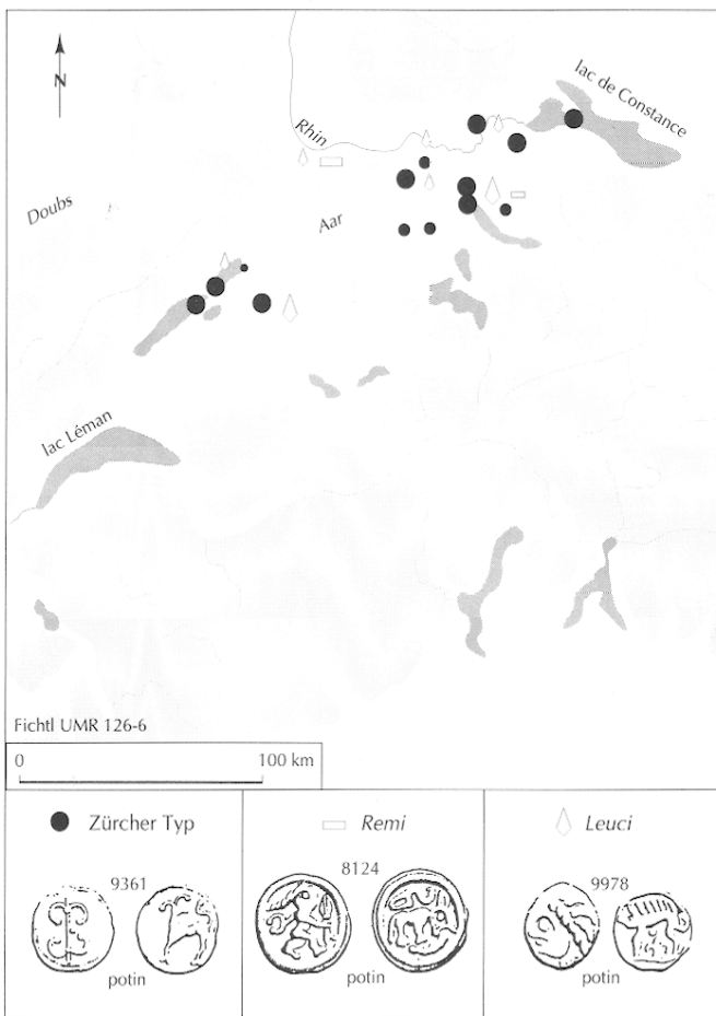
Fig. 33. Diffusion des types de potins en Suisse nord-orientale (Bâle-ville et Bâle-campagne ne sont pas pris en compte, sauf Augst).