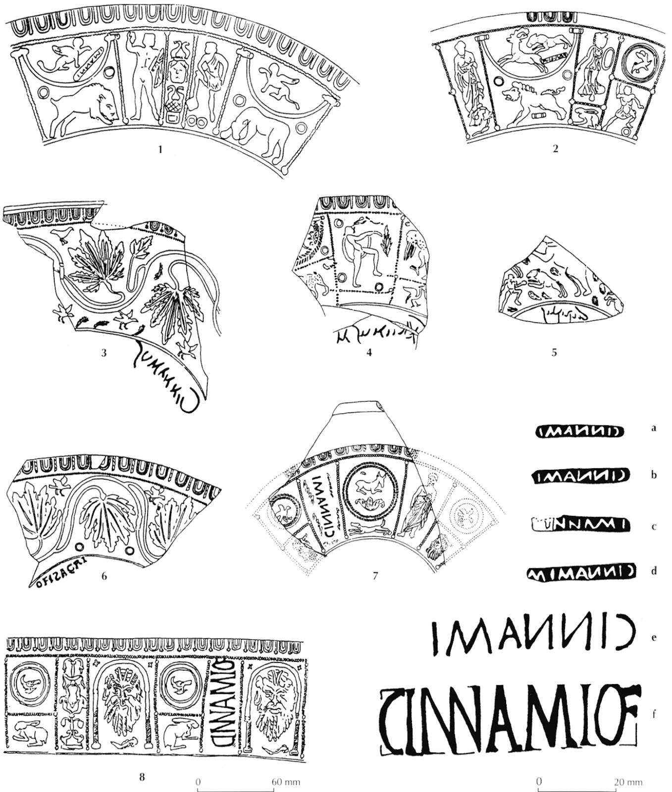
Fig. 78 – Marques intradécoratives au nom de Cinnamus (a-f, cf. Romeuf-Vialatte, 1970) et décors avec marque épigraphique du groupe Cinnamus : a, b, e, estampilles rétrogrades de graphie CINNAMI ; c, estampille antégrade de graphie [C]INNAMI ; d, estampille rétrograde de graphie CINNAMIM ; f, estampille antégrade de graphie CINNAMIÖF ; 1, vase moulé comportant une petite estampille intradécorative rétrograde de graphie CINNAMI (estampille b), provenance : Étaples, Pas-de-Calais (Piton, 1985, pl. 13, n° 3) ; 2, vase moulé comportant une petite estampille intradécorative rétrograde de graphie PAVL.I.I.M, provenance : Wroxeter, Shropshire, Grande-Bretagne (Stanfield, Simpson, 1990, pl. 165, n° 1) ; 3, vase moulé comportant une marque cursive infradécorative rétrograde de graphie Cinnamus, provenance : Chester, Cheshire, Grande-Bretagne (Stanfield, Simpson, 1990, pl. 162, n° 57) ; 4, vase moulé comportant une marque cursive infradécorative rétrograde de graphie Galiinus M, provenance : Les Martres-de-Veyre, Puy-de-Dôme (Romeuf, Romeuf, 2001, pl. 108, n° 2) ; 5, vase moulé comportant une marque cursive infradécorative rétrograde de graphie Ciirialis, provenance : Amiens, Somme (Rogers, 1999, pl. 29, n° 4) ; 6, vase moulé comportant une estampille infradécorative antégrade de graphie OFISACRI, provenance : Corbridge, Northumberland, Grande-Bretagne (Stanfield, Simpson, 1990, pl. 83, n° 8) ; 7, vase moulé comportant une estampille intradécorative rétrograde de graphie CINNAMI (estampille e), provenance : Hallstatt, Haute-Autriche (Karnitsch, 1959, pl. 75, n° 1) ; 8, moule comportant une estampille intradécorative antégrade CINNAMIÖF (estampille f), provenance : Terre-Franche à Bellerive-sur-Allier, Allier (Vauthey, Vauthey, 1993, p. 41, fig. 28).