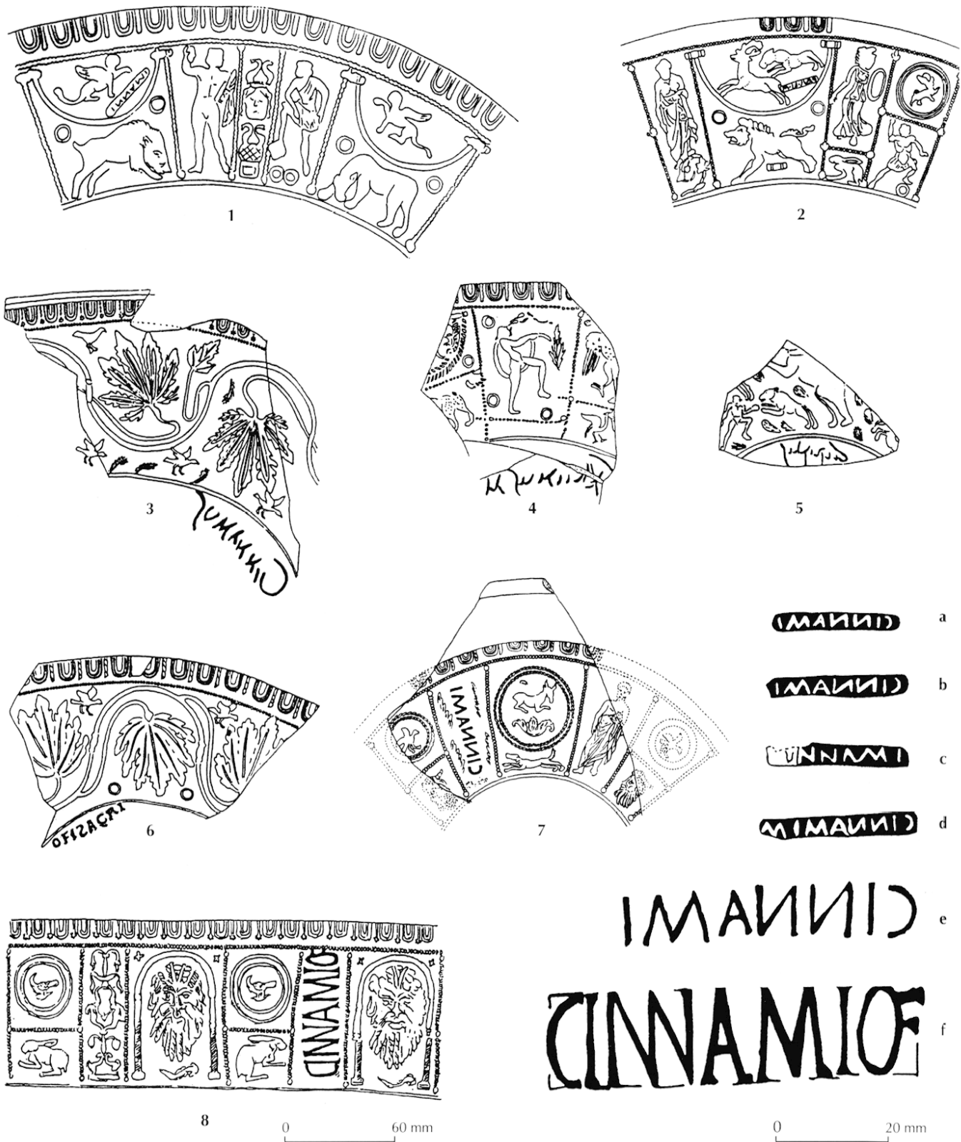
Fig. 78 – Marques intradécoratives au nom de Cinnamus (a-f, cf. Romeuf-Vialatte, 1970) et décors avec marque épigraphique du groupe Cinnamus : a, b, e, estampilles rétrogrades de graphie CINNAMI ; c, estampille antégrade de graphie [C]INNAMI ; d, estampille rétrograde de graphie CINNAMIM ; f, estampille antégrade de graphie CINNAMIÖF ; 1, vase moulé comportant une petite estampille intradécorative rétrograde de graphie CINNAMI (estampille b), provenance : Étaples, Pas-de-Calais (Piton, 1985, pl. 13, n° 3) ; 2, vase moulé comportant une petite estampille intradécorative rétrograde de graphie PAVL.I.I.M, provenance : Wroxeter, Shropshire, Grande-Bretagne (Stanfield, Simpson, 1990, pl. 165, n° 1) ; 3, vase moulé comportant une marque cursive infradécorative rétrograde de graphie Cinnamus, provenance : Chester, Cheshire, Grande-Bretagne (Stanfield, Simpson, 1990, pl. 162, n° 57) ; 4, vase moulé comportant une marque cursive infradécorative rétrograde de graphie Galiinus M, provenance : Les Martres-de-Veyre, Puy-de-Dôme (Romeuf, Romeuf, 2001, pl. 108, n° 2) ; 5, vase moulé comportant une marque cursive infradécorative rétrograde de graphie Ciirialis, provenance : Amiens, Somme (Rogers, 1999, pl. 29, n° 4) ; 6, vase moulé comportant une estampille infradécorative antégrade de graphie OFISACRI, provenance : Corbridge, Northumberland, Grande-Bretagne (Stanfield, Simpson, 1990, pl. 83, n° 8) ; 7, vase moulé comportant une estampille intradécorative rétrograde de graphie CINNAMI (estampille e), provenance : Hallstatt, Haute-Autriche (Karnitsch, 1959, pl. 75, n° 1) ; 8, moule comportant une estampille intradécorative antégrade CINNAMIÖF (estampille f), provenance : Terre-Franche à Bellerive-sur-Allier, Allier (Vauthey, Vauthey, 1993, p. 41, fig. 28).