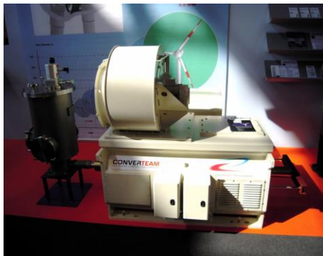
Fig. 3. Machine synchrone à 2 paires de pôles avec inducteur triphasé classique et inducteur supraconducteur. A gauche du moteur on voit le cryocooler qui assure le refroidissement à 30K.

Cette machine a été développée dans le cadre d'un projet européen [9] auquel a participé notre laboratoire. Il s'agit d'une machine de 250 kW dont l'inducteur, à 2 paires de pôles, muni de supraconducteur en BSCCO, est refroidi à 30K par un cryocooler.