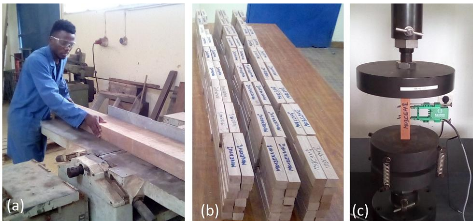
Fig. 2. (a) Dégauchissage de la poutre. (b) Epreuves pour la caractérisation e la variabilité spatiale. (c) Dispositif expérimental d'essai de compression.