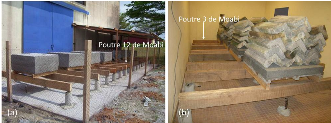
Fig.1 : (a) Environnement extérieur non abrité. (b) Environnement climatisé