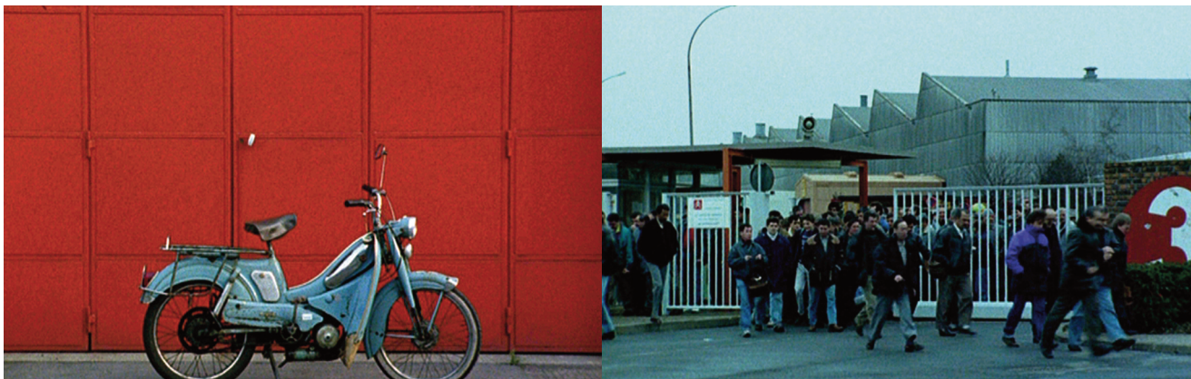
Les choses rouges, 1994.