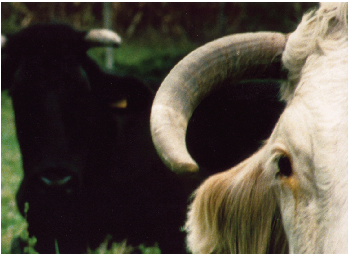
Is Dead (Portrait incomplet de Gertrude Stein), 1999.