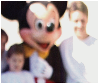
Disneyland, mon vieux pays natal, 2001.

... de faire ce que l'on ne peut pas faire – ramener le passé à la vie – et peut-être y parvenir malgré tout, car l'art n'est-il pas justement, selon Gilles Deleuze, ce qui résiste, y compris à la mort ? Et le cinéaste d'ajouter : "Certains font toujours le même film, ils approfondissent quelque chose. Personnellement, je me sens plus proche de quelqu'un comme Stein, dont une phrase est devenue pour moi comme une sorte d'emblème : Si on peut le faire, pourquoi le faire ?"