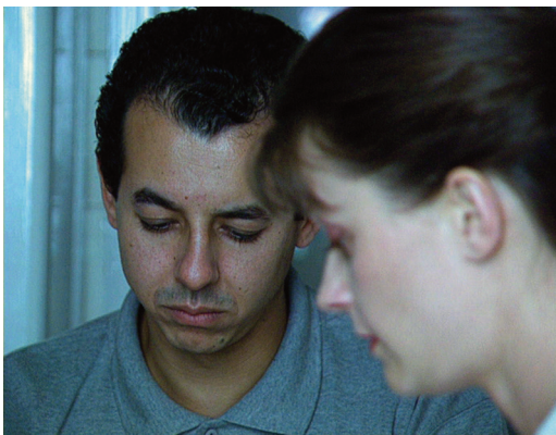
Avant après, 1993.

la valeur du plan : "Nous montons cette fois des groupes, des bulles de plans" explique le cinéaste. On retrouve toujours cette dissociation voir/parler, devenue structurante : les images entrent en correspondance avec un univers sonore entièrement recréé en studio, à la fois pour des questions d'écriture et de copyright. Un monde singulier et effrayant, triste aussi, est dépeint : nous voyageons dans l'esprit du cinéaste qui décrypte Disney avec d'autres codes.