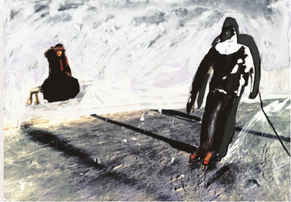
Light Years, 1987.