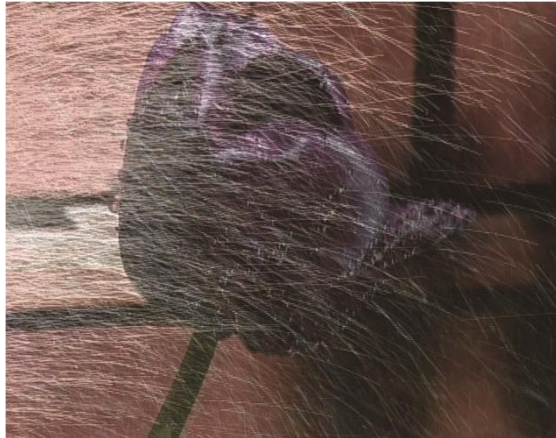
True to life, 1987.alltintill