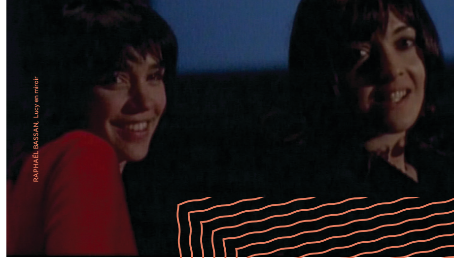
RAPHAËL BASSAN, Lucy en miroir

Si le critique éclaire avec tant de justesse et d'empathie l'imaginaire radical de l'underground, c'est peut-être parce qu'il est d'abord né poète. Agencés dès 1964 et publiés dans la revue Le Point d'Être en 1970, certains de ses poèmes ont été réédités dans le recueil intitulé Rites et rituels — Poèmes 1966-1972 (Europe/Poésie, 2001).