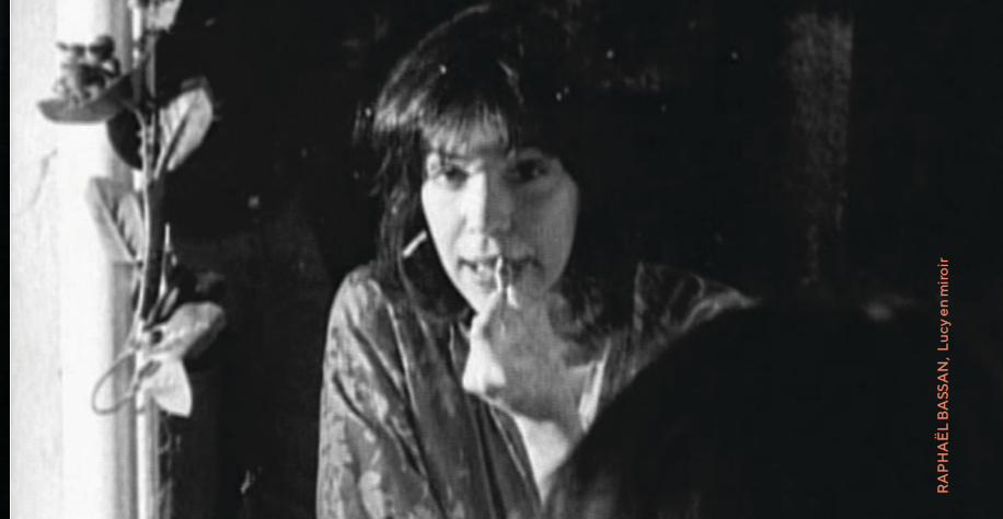
RAPHAËL BASSAN, Lucy en miroir

Voir, faire voir et être vu. Le film mis en regard est représentation pure chez Raphaël Bassan qui expose le cinéma en train de se faire. Les deux premiers opus se présentent, dans un écho lointain aux films de Maya Deren 6 et de Philippe Garrel, comme des psychodrames beat louant la transe des corps et la poésie des objets.