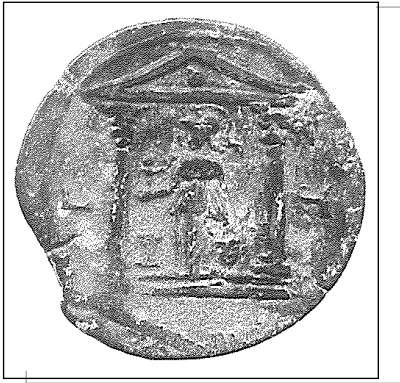
Fig. 3 : Temple d'Athèna sur une monnaie d'Alexandrie datant du règne d'Antonin le Pieux.