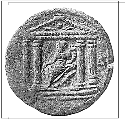
Fig. 4 : Neilaion sur une monnaie d'Alexandrie datant du règne d'Antonin le Pieux.