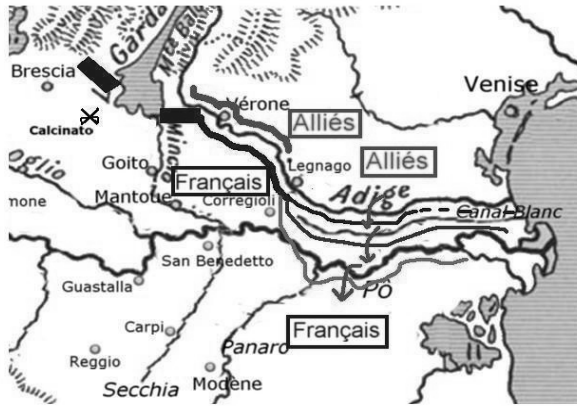
Fig. 2 – Franchissement de l'Adige, du Canal Blanc et du Pô, 6-18 juillet 1706

L'armée de Lombardie devait ainsi se résigner à gagner du temps, et éviter à tout prix d'affronter une armée impériale localement supérieure.