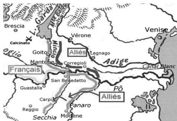
Fig. 4 – Marche du prince Eugène à Turin, 5 août-7 septembre 1706