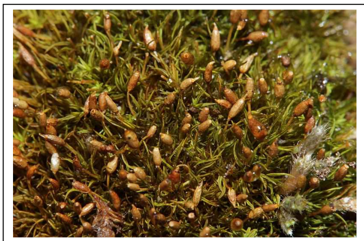
Figure 2: Weissia brachycarpa.

Cette petite acrocarpe en rosette forme des petits tapis épars de quelques mm 2 à la surface du sol. Elle possède des feuilles filiformes et pointues qui s'enroulent sur elles-mêmes à l'état sec. La distinction des espèces du genre se fait principalement à l'aide de la capsule cylindrique. Chez Weissia brachycarpa , la capsule possède une ouverture étroite, entourée d'une petite membrane. Cette espèce se rencontre principalement en situation sèche et calcaire, sur des sols dénudés sur pelouses calcicoles, éboulis ou plus rarement sur sols perturbés. Elle a été observée ici au sein de la pelouse de la Butte du Puits. C'est la 5 e mention sur la région Ile-de-France et la première pour le département de l'Essonne.