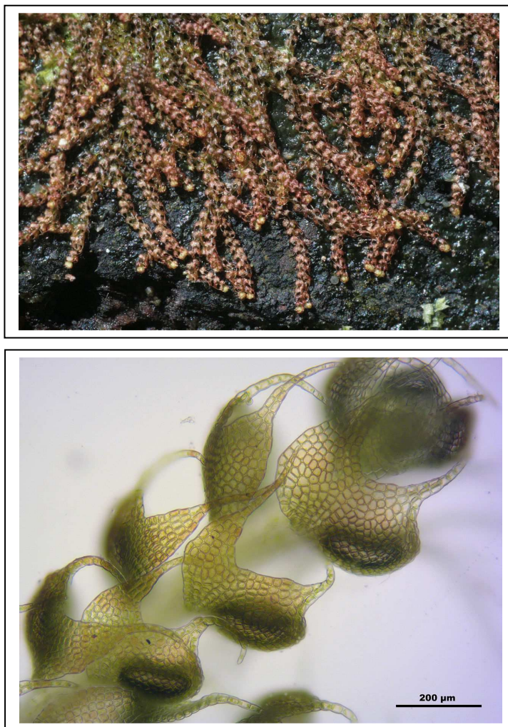
Figure 3 : Nowellia curvifolia vue d'ensemble et détail de feuille.

Elle a été trouvée à une seule reprise sur un tronc d'arbre couché et pourrissant humide, sur le site de la Butte du Puits. Elle est indicatrice du bon fonctionnement d'un milieu.