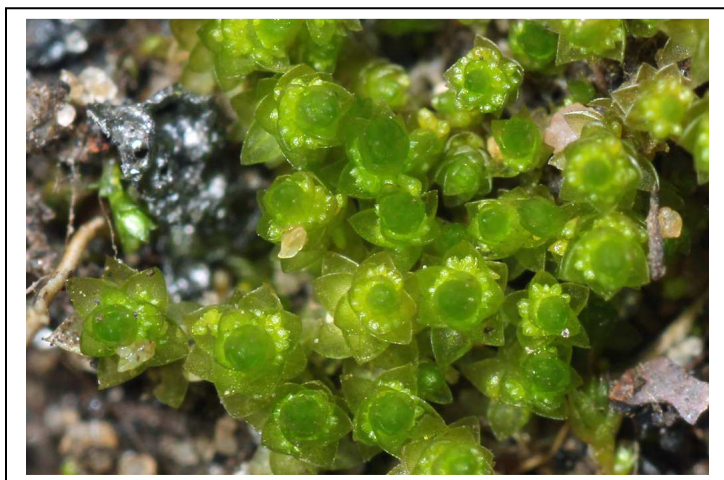
Figure 1: Bryum dichotomum.

et peut aussi se rencontrer sur des sols compacts, les bords des routes, les jardins et divers autres habitats perturbés. Elle a déjà été trouvée à 5 reprises sur la région Ile-de-France, ces dernières années.