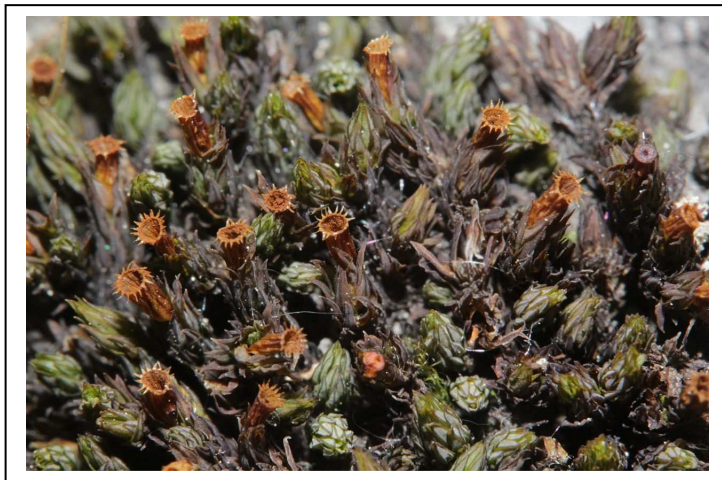
Figure 6 : Orthotrichum cupulatum , vue d'ensemble et détail de la capsule.