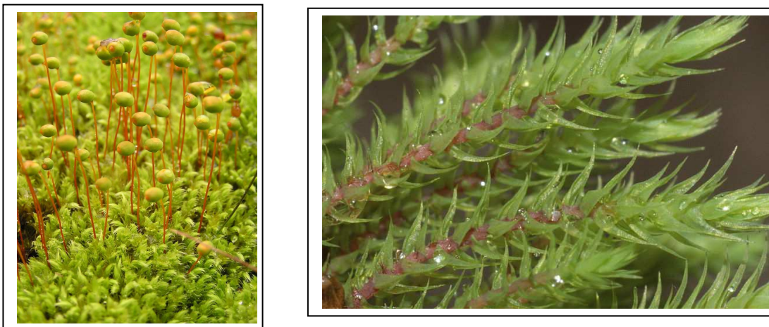
Figure 3 : Philonotis calcarea , (Source : CommonWikipedia)

Rarement observée en Ile-de-France, elle a été identifiée à deux endroits sur le site. Une première fois, au pied de blocs rocheux non loin de la zone humide centrale et une autre fois, sur le haut du fossé au sein d'une roselière.