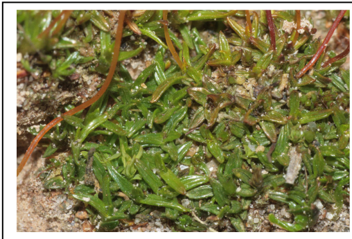
Figure 2 : Aloina ambigua.

Cette petite acrocarpe en rosette, forme des petits tapis épars de quelques mm 2 à la surface du sol. Comme toutes les Aloina , elle possède des feuilles charnues à bords recourbés en capuchon et arrondies à leur extrémité et se distingue des autres espèces du genre, par la présence d'une membrane entre les dents du péristome et la capsule. Cette espèce se trouve en situation calcaire, sur des sols minces, bien drainés et bien ensoleillés, sur des corniches ou dans d'anciennes carrières. Cette espèce observée ici au pied d'un petit éboulis crayeux est probablement moins rare qu'elle n'y paraît.