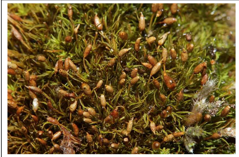
Figure 4 : Weissia brachycarpa.

Cette petite acrocarpe en rosette forme des petits tapis épars de quelques mm 2 à la surface du sol. Elle possède des feuilles filiformes et pointues qui s'enroulent sur elles-mêmes à l'état sec. La distinction des espèces du genre se fait principalement à l'aide de la capsule cylindrique. Chez Weissia brachycarpa , la capsule possède une ouverture étroite, entourée d'une petite membrane. Cette espèce se rencontre principalement en situation sèche et calcaire, sur des sols dénudés soit sur pelouse calcicole, ou bien dans les éboulis ou sur sols perturbés.