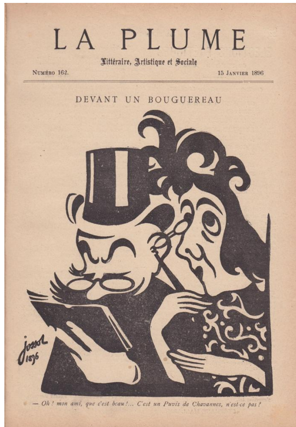
Illustration 4 Gustave Jossot, « Devant un Bouguereau », La Plume , n° 162, 15 janvier 1896. Coll. part.