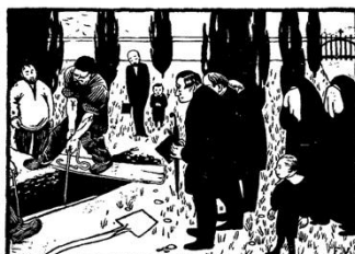
Un enterrement en province.

LA RENAISSANCE DE LA GRAVURE SUR BOIS. 417 Quesnel, Hayot, Baulé et Pannemaker, on ne trouve guère que des ouvriers d'une habileté extraordinaire, mais sans originalité réelle. Tous singent le procédé et s'essayent à reproduire sur buis les finesses et les empâtements de couleur des tableaux reproduits. Ils n'interprètent pas en y apportant cette note personnelle qui est la caractéristique des artistes; ils copient en esclaves.