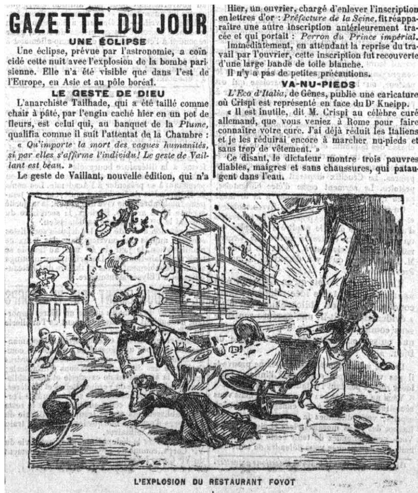
Fig. 1. La Croix , 6 avril 1894, p. 1. Coll. part.

Ces événements deviennent des lieux obligés de toute évocation de ces personnalités. Les images mêmes diffusées à l'époque fonctionnent comme des souvenirs de ce que personne n'a vu : ce sont les « mêmes » de l'histoire littéraire (fig. 1).