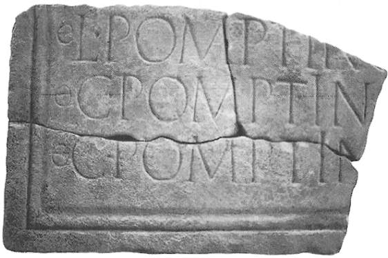
Fig. 1. L'inscription d'Aigues-Vives.

graphique est en marbre clair. Le champ épigraphique est bordé à gauche et en bas d'une moulure régulière. Sur ce matériau d'excellente qualité la gravure des lettres, effectuée avec soin, conservait toute sa netteté aux trois dernières lignes conservées. L'observation du site, il est vrai superficielle, n'a pas fourni pour l'instant d'autre élément archéologique significatif.